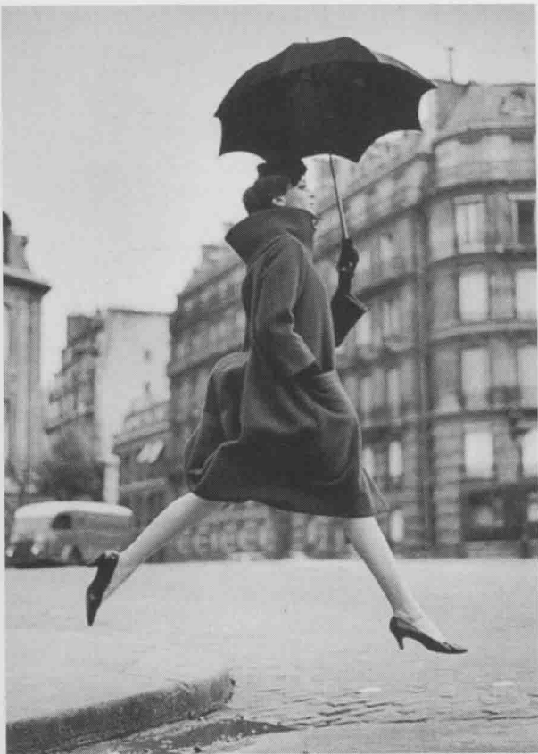
图 1-8 《向芒卡西致敬》，理查德·阿威顿摄于 1957 年

随着“二战”结束，社会进入了平稳的发展时期，工商业的发展速度越来越快，人们也开始更注重物质生活。随着小型照相机的快速发展与广泛应用，以及彩色印刷技术的进步，使时尚摄影师获得了更多的拍摄方式，户外摄影、水上摄影等新的现代元素也加入时尚摄影中，照片的品质也有了很大提高，使时尚摄影散发出更夺目的光彩。