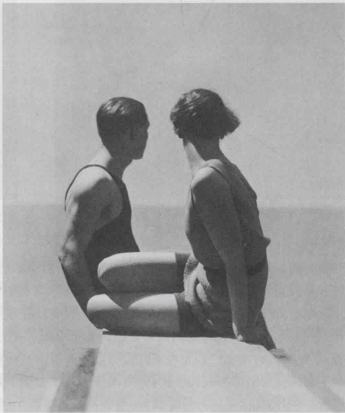
图1-3 《潜水员》,乔治·霍伊宁成-许恩摄于1930年,法国

德国摄影师霍斯特·P·霍斯特(Horst P. Horst, 1906—1999)在时尚摄影史上也具