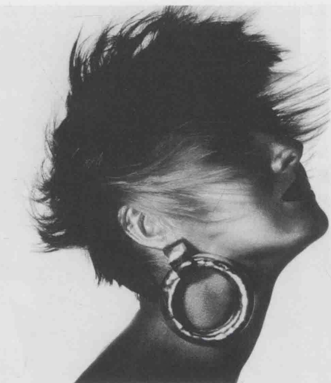
图 1-9 《无题》，欧文·佩恩摄

在这一时期，还有几位摄影家的实验性创作，为时尚摄影的发展作出了有益的尝试。美国人路易斯·达尔-沃尔夫(Louise Dahl-Wolfe, 1895—1989)是拍摄彩色时装照片的先驱之一，她也是最早使用柯达克罗姆胶片进行时尚摄影的摄影师。她在拍摄过程中刻意追求用光与构图效果，强调色彩激动人心的对比力量。美国摄影家欧文·布鲁门菲尔德(Erwin Blumenfeld, 1897—1969)作为一个摄影实验