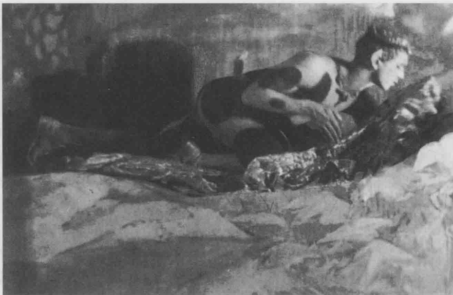
图 1-1 《尼金斯基》,德·梅耶摄于 1912 年

摄影杂志《摄影作品》上,并在 291 画廊展出。1912 年,俄罗斯芭蕾舞团到伦敦演出,德·梅耶借此机会,以著名的舞蹈家尼金斯基为模特,拍摄了代表作《尼金斯基》(图 1-1)。这幅作品,引起了摄影界的关注。德·梅耶,这个原本没有任何贵族血统的人,却凭借其在摄影上的卓越表现,被皇家资助者授予了男爵封号。