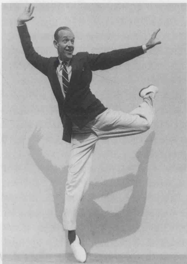
图 1-6 《弗雷德·阿斯泰尔》，马丁·芒卡西摄