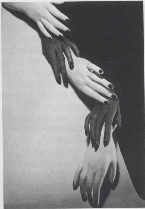
图 1-5 《手,手》，霍斯特·P.霍斯特摄于 1941 年

有很高的地位。他的时尚摄影,已明显突破了画意摄影的束缚,强调个人化表现,常常将模特、人体加以夸张与变形,以超现实主义风格,在充满暧昧元素的影像中探索着人物的内心世界。