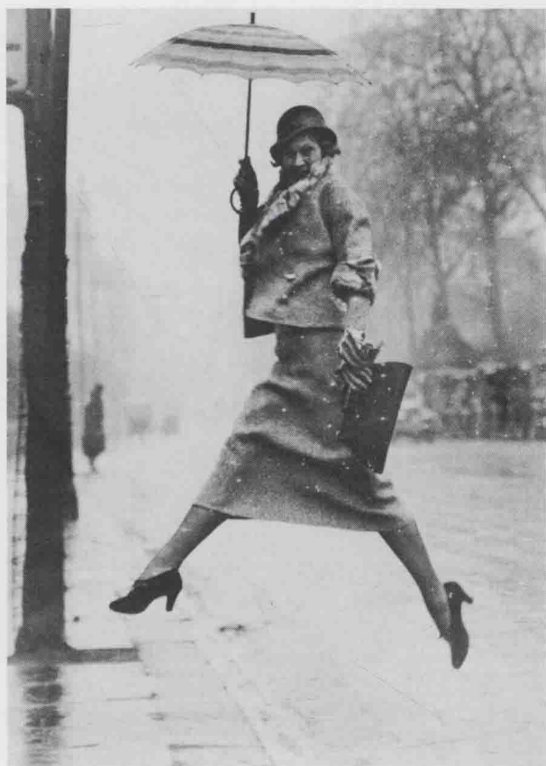
图 1-7 《跳水坑》，马丁·芒卡西摄于 1934 年

然与生动，富有现代感。芒卡西的时尚作品在当时看来确实标新立异，独树一帜，具有强大的视觉冲击力。