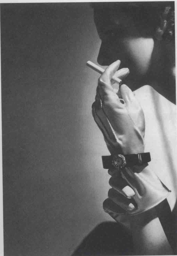
图 1-4 《手链与钻石手表》，霍斯特·P.霍斯特摄于 1935 年