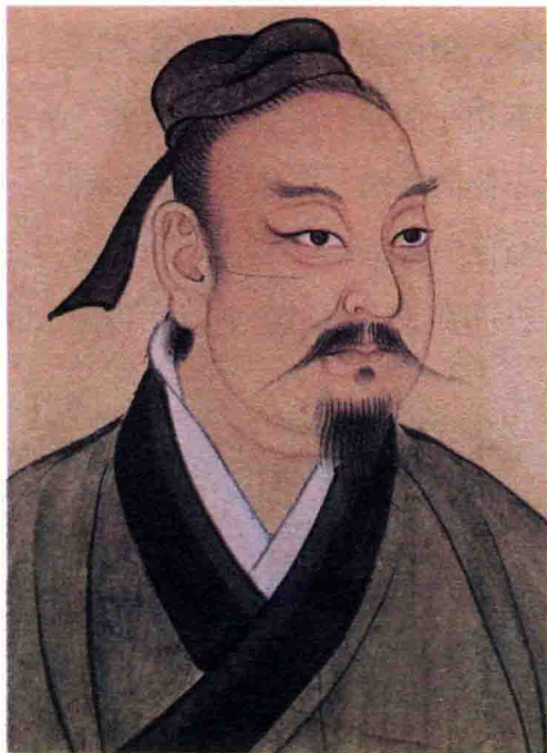
■ 战国最为出色的战将吴起画像

他著有《吴子》一书，《吴子》与《孙子》又合称《孙吴兵法》，在我国古代军事典籍中占有重要地位，对后世具有重要的影响性。