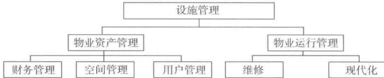
图 1Z201011-2 IFMA 确定的设施管理的含义

国际设施管理协会(IFMA)所确定的设施管理的含义，如图 1Z201011-2 所示，它包括物业资产管理和物业运行管理，这与我国物业管理的概念尚有差异。