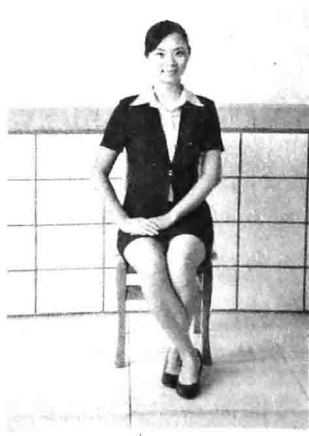
女士脚踝盘住收起式