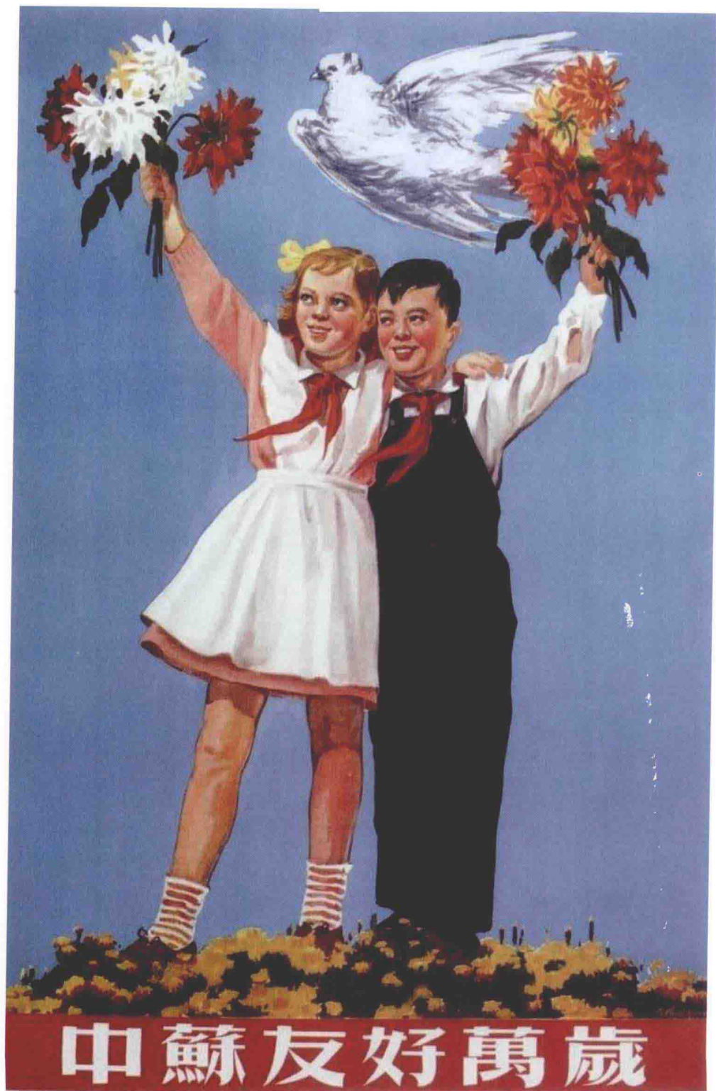
20世纪50年代的中苏友好宣传画