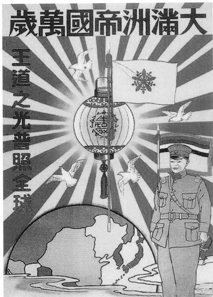
伪满宣传画吹嘘所谓“王道乐土”