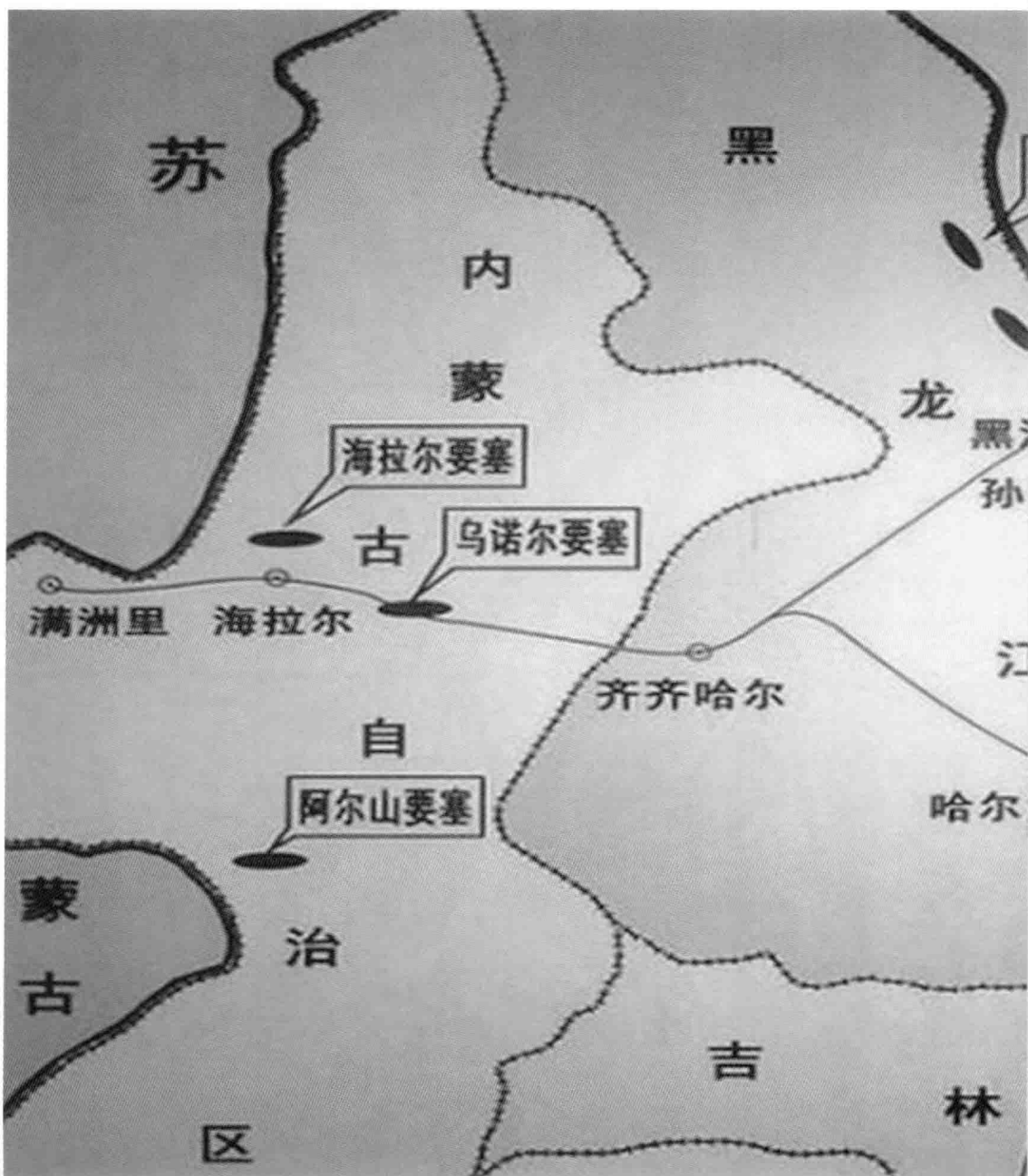
日军在满洲边境建立的筑垒地域