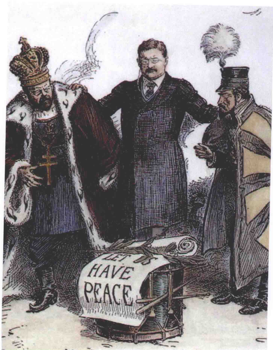
西奥多·罗斯福通过斡旋使日俄在远东形成力量平衡