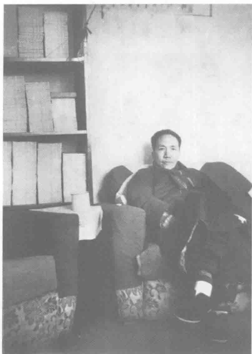
陳寅恪在北平清華大學新林院五二 號書房內 一九四七年末