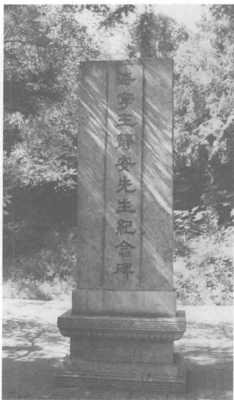
海寧王靜安先生紀念碑 一九一九年立於清華大學校園內