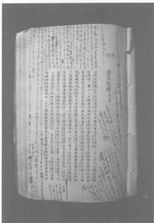
陳寅恪讀唐人小說「續玄怪錄」時 所寫批語