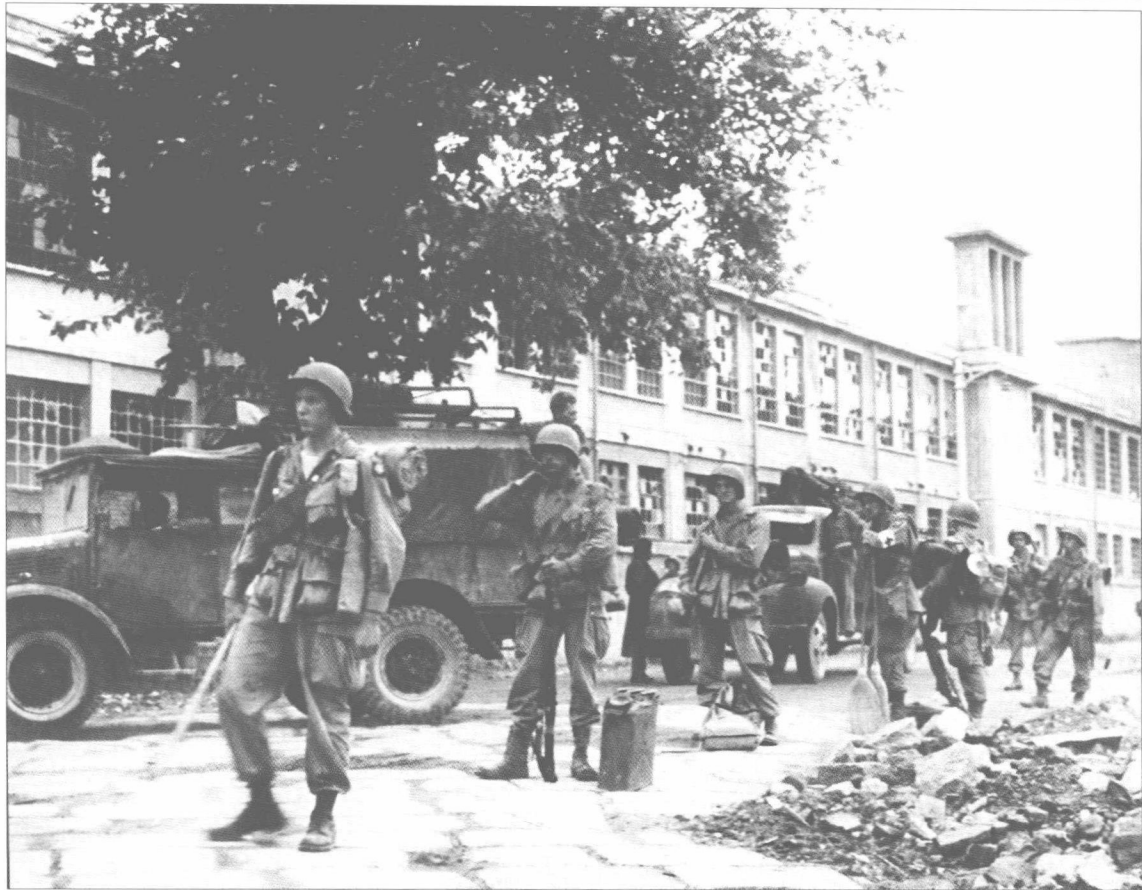
■ 1943年10月1日，美军第82空降师第505伞兵团作为第一支盟军部队进入那不勒斯。

泥浆卷走，沃尔图诺河沿岸根本无法实施任何架桥作业，盟军的推进因此受阻。此次规模巨大的洪灾持续时间将近一个月，美军被困在那不勒斯近郊，直到10月中旬洪水消退才重新恢复挺进。临近11月，第5集团军左翼的侦察单位抵达加利格里阿诺河(River Garigliano)下游旁的伯恩哈特防线(Bernhardt Line)，试图从米尼亚诺隘口(Gap Mignano)上找到一个通往罗马的突破口。又过了三天，英军第10军开始攻打米尼亚诺隘口东南面的卡米诺山(Monte Camino)，遇到德军抵抗。克拉克意识到第5集团军因为连续作战已疲惫不堪，被迫传令让部队暂时休整两个星期。