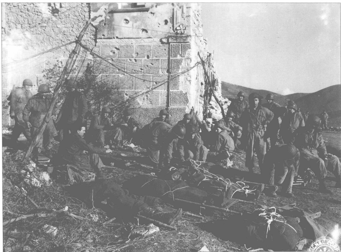
■ 上图及下图为圣皮耶特罗因菲内之战中第36步兵师第141步兵团的救治中心，美军医护兵正忙着将圣诞节时的伤亡人员运离战区。