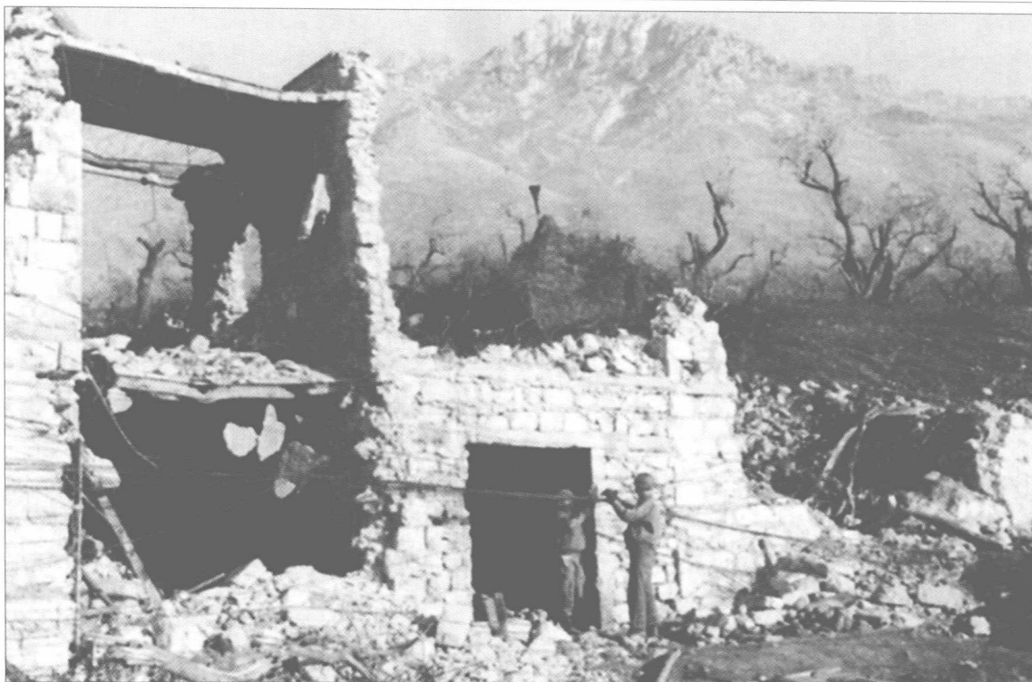
■ 正在圣皮耶特罗因菲内的废墟瓦砾中架设电话线的美军士兵。