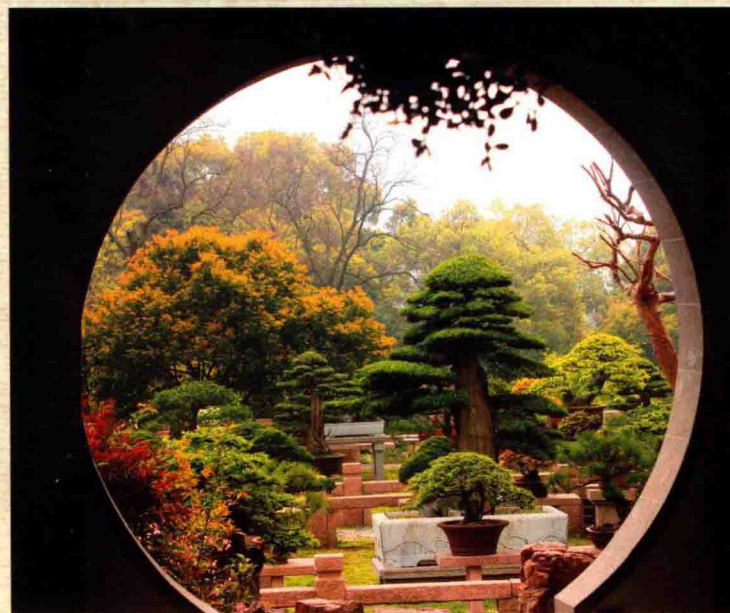
当年的绍隆塔院，今已成苏派盆景园