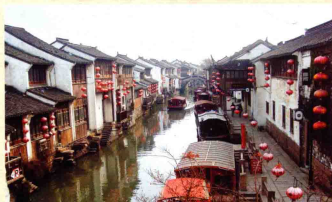
河街并行的山塘街