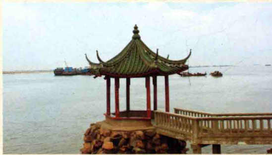
太仓境内长江口的望江亭