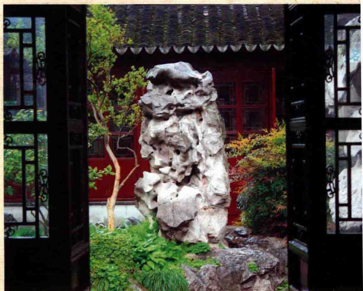
怡园：坡仙琴馆内赏奇石