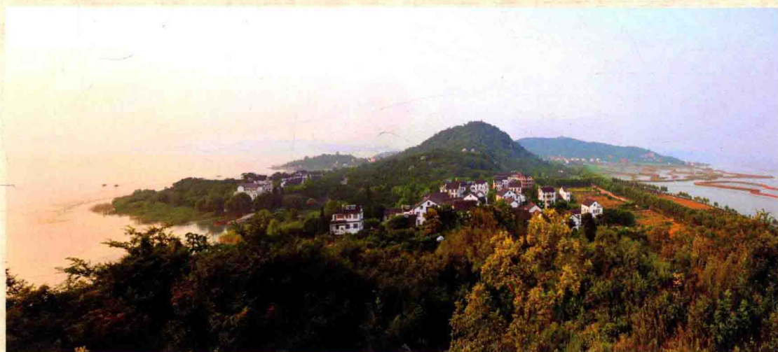
三山岛：太湖中的人间仙境