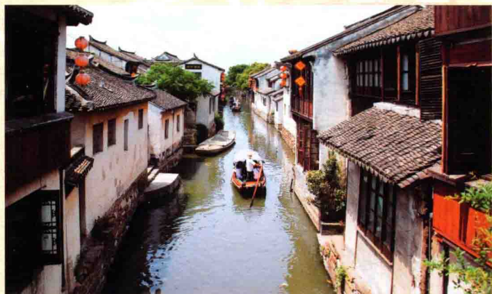
中国水乡古镇的代表——周庄