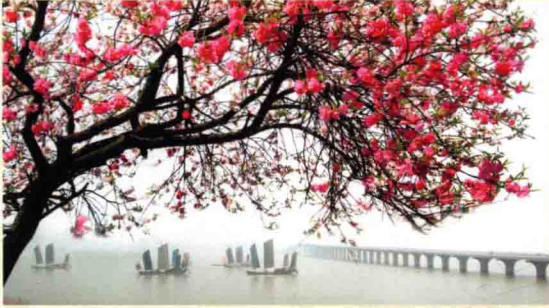
太湖大桥如长虹卧波