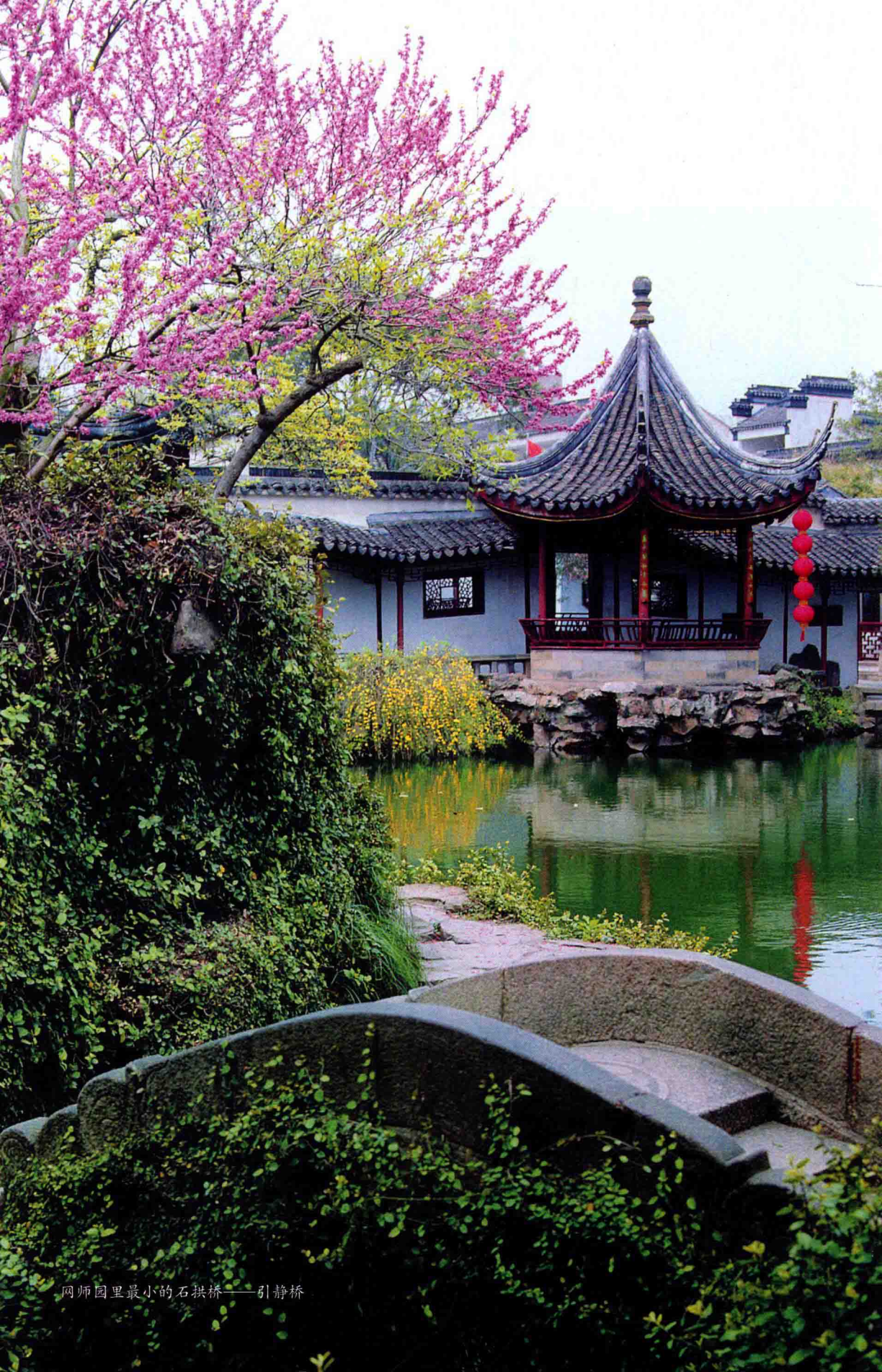
网师园里最小的石拱桥——引静桥