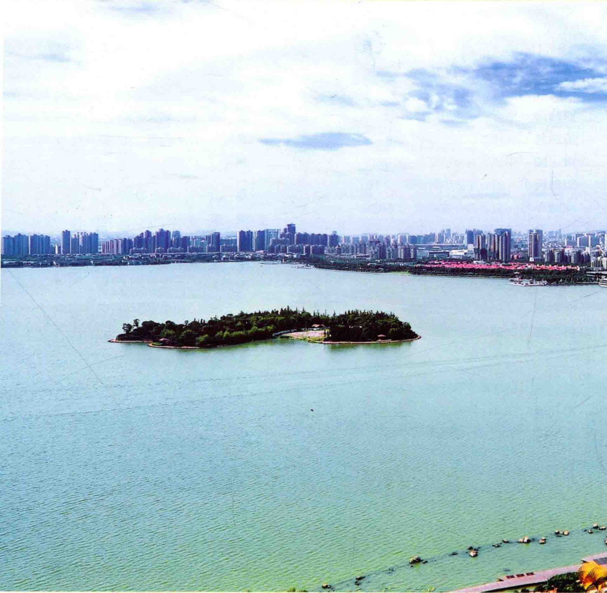
中国最大的城市湖泊公园——金鸡湖气象万千