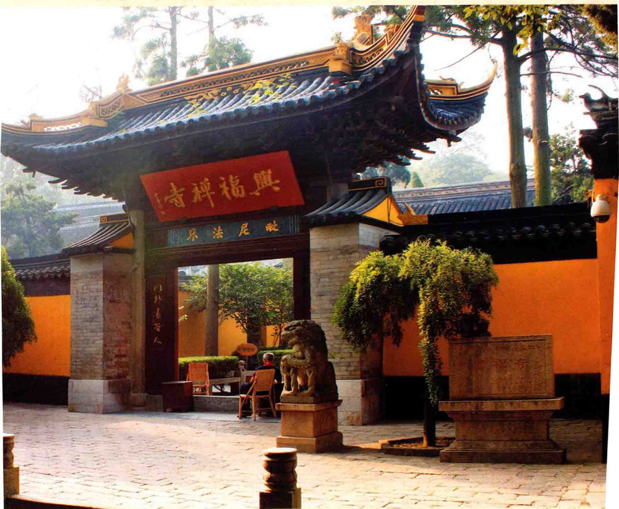
虞山脚下的南梁古刹兴福寺