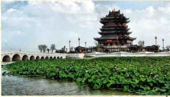
重元寺观音阁，建于阳澄湖莲花岛上