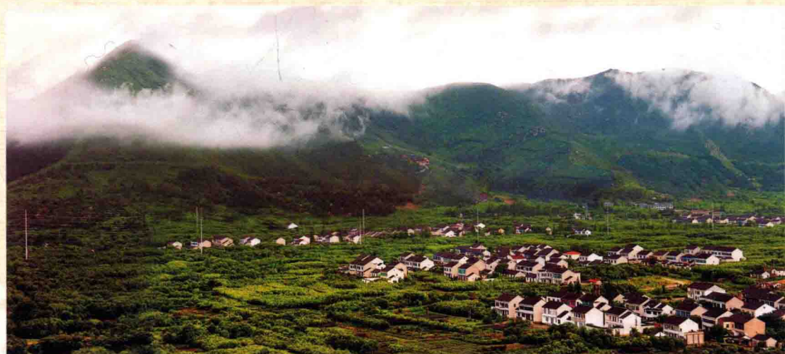
大阳山，苏州的第二大高山，生态良好，古迹众多