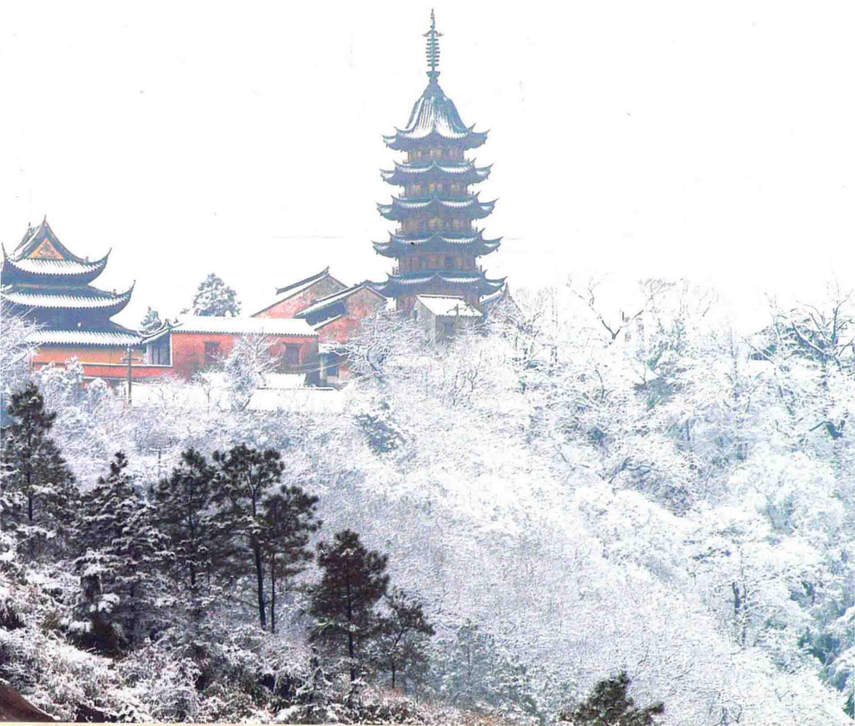
灵岩山：当年吴宫遗址，今日雪裹妖娆