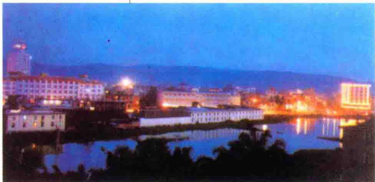
神奇美丽的西双版纳