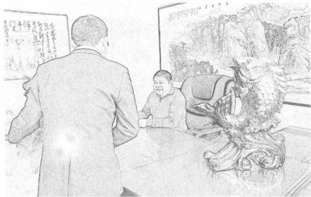
4. 第二天荷官如实报告给老板。查获出老千的日本人。撵出赌场。