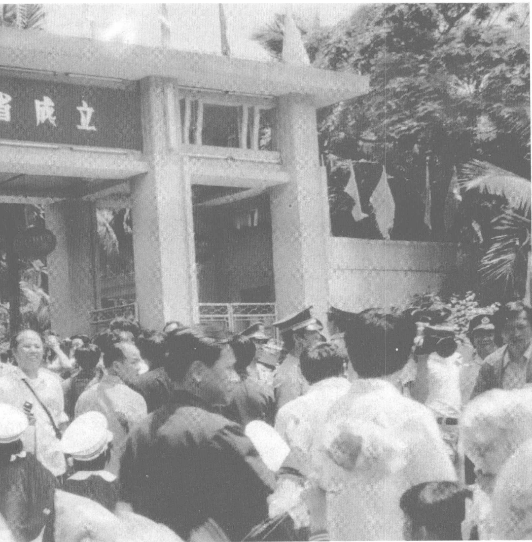
■ 1988年4月26日， 海南省人民政府正 式成立挂牌。