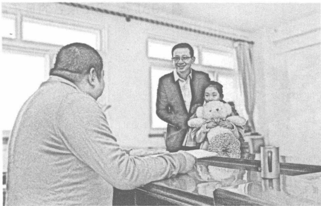
1. 1941年上海，赌场老板办公室，一荷官对老板说：“明天孩子没人带，可不可以让孩子在场子里自己转，孩子非常懂事，不会惹事的。”老板同意了。