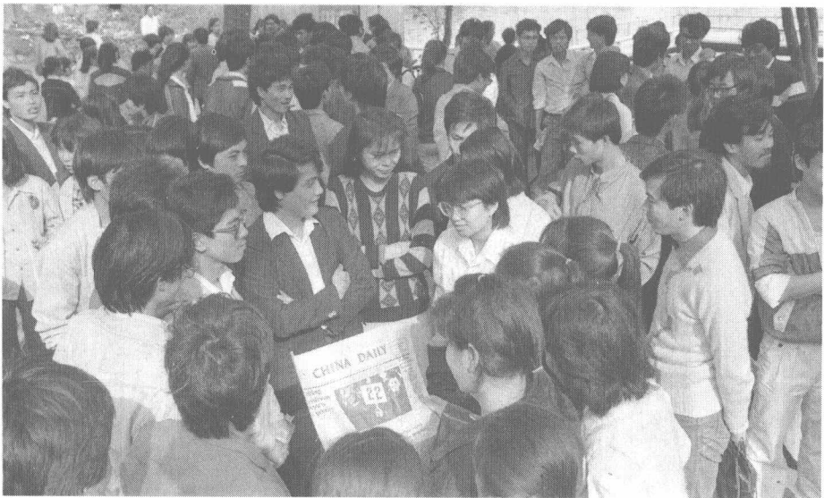
■ 1989年，海口市东湖英语角。