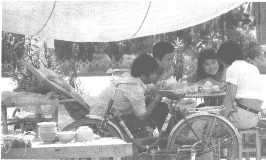
■ 1988年，海口东湖三角池的大学生饭店。