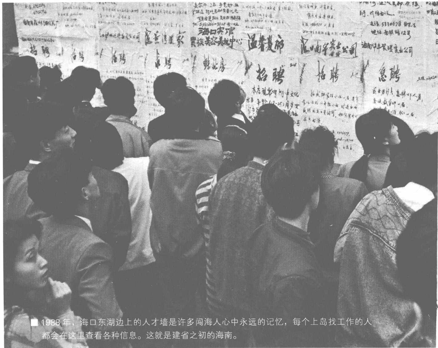
■ 1988年，海口东湖边上的人才墙是许多闯海人心中永远的记忆，每个上岛找工作的人都会在这里查看各种信息。这就是建省之初的海南。