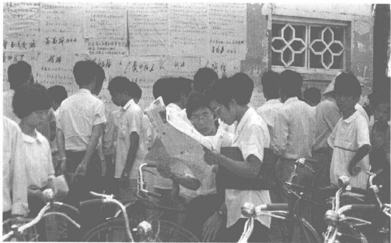
▲ 1989年，海口市东湖人才墙聚集的闯海者。

▼ 1989年，海南建省后吸引不少内地人才到海南参与开发建设，但一时也给落后的海南岛带来压力。