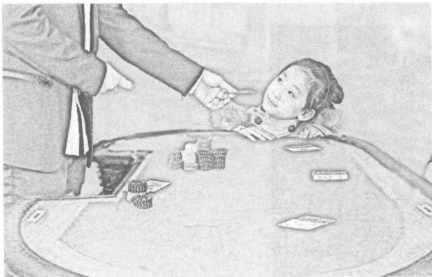
2. 小女孩好奇的看爸爸发牌，看赌客玩牌。