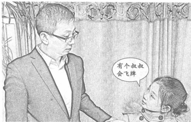
3. 晚上，小女孩告诉爸爸：我遇见神仙了。神仙？有个小胡子叔叔袖子里会飞东西。