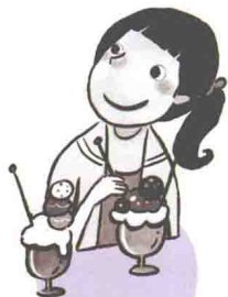
最漂亮的小乔老师