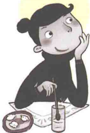
超级爱逛商场的马太太