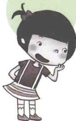
声音小小 个子小小的米小小