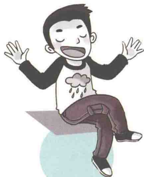
喜欢讲笑话的转校生 龙骨