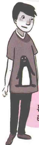
喜欢凑热闹 的好好先生 马先生