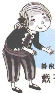
善良可爱的 戴花婆婆