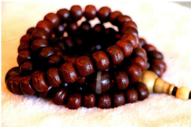
盘玩后的凤眼菩提子