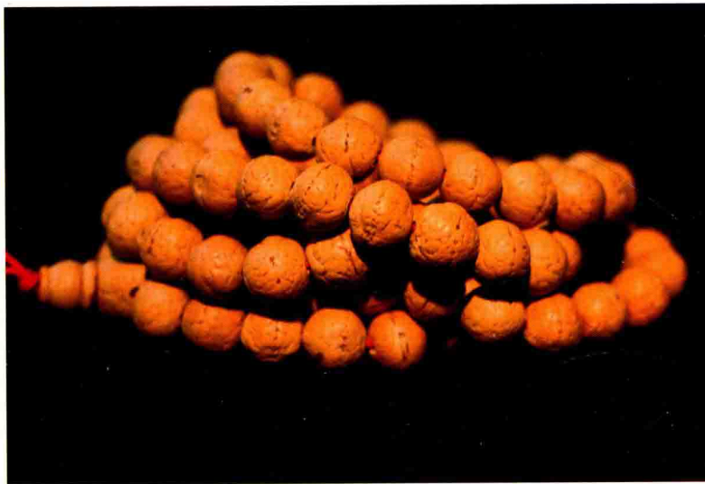
未上手盘玩的凤眼菩提子