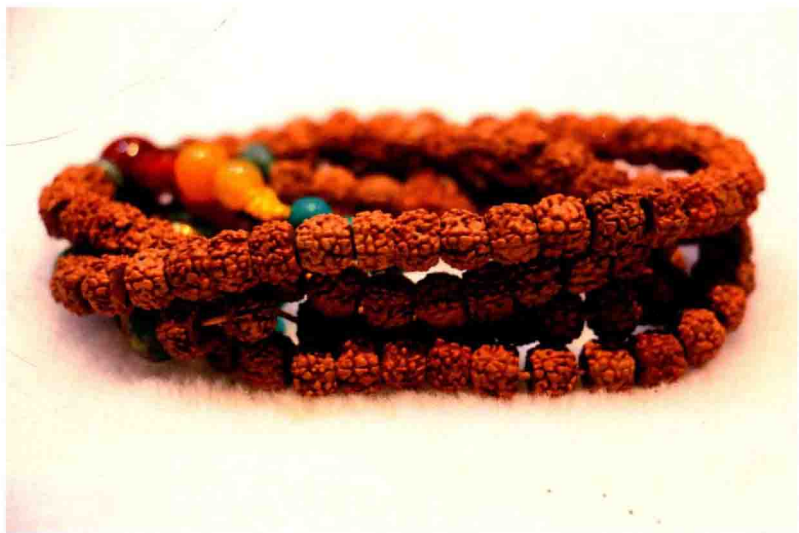
未经盘玩的金刚菩提子

金刚菩提子很少作假，市场上会出现切瓣数，但是五瓣以内的很少有假。金刚菩提子的价值就在于瓣数，切瓣数的目的也是为把价格做高。玩友在购买时，一看纹理，因为每一颗菩提子的纹理几乎没有完全一样的，天然菩提子多多少少都会有裂痕存在。二看外形，越扁的金刚菩提子越好，而且不要选籽实的形状不正，或者有残缺、有棱角的金刚子。因此想要选到一串上好的金刚菩提子，必