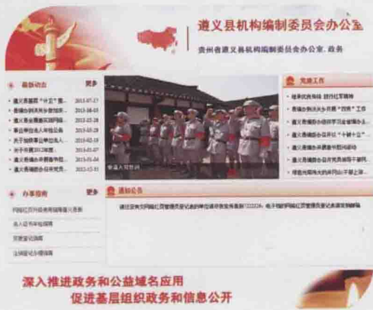
图26 遵义县编委办网络红页(2013-06)