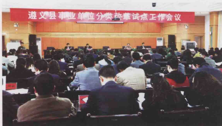
图15 遵义县召开事业单位分类改革试点工作会(2012-11)