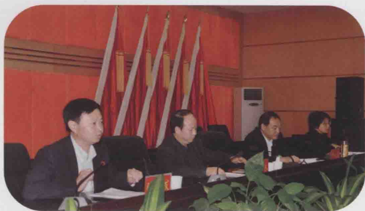
图17 遵义县 举办事业单位清理 规范工作业务培训 会(2011-11-23)