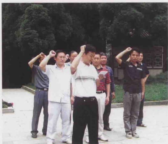
图28 遵义县编委办党支部在娄山关开展党组织活动(2009-06)