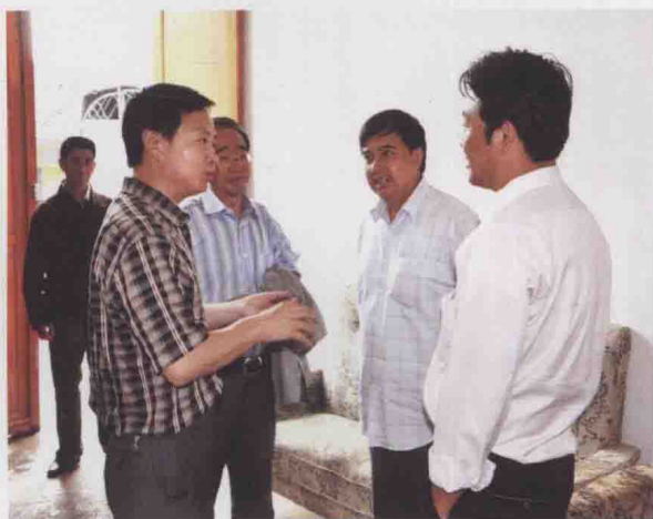
图29 遵义县编委办在西坪镇南坝村开展结对帮扶工作(2010-02)