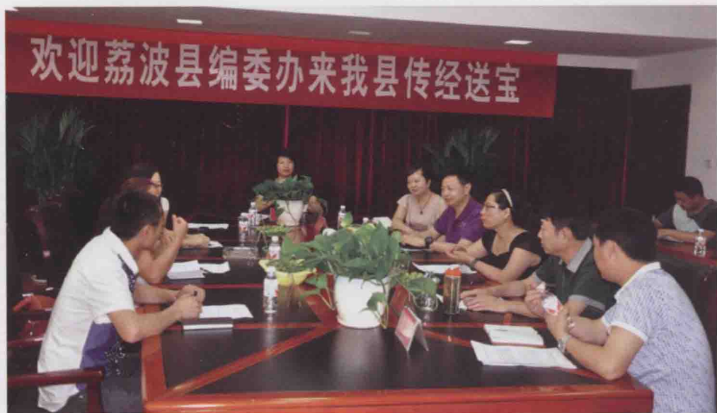
图 22 荔 波县、平塘县编 委办一行在遵 义县交流学习 事业单位分类 工作(2013-06)