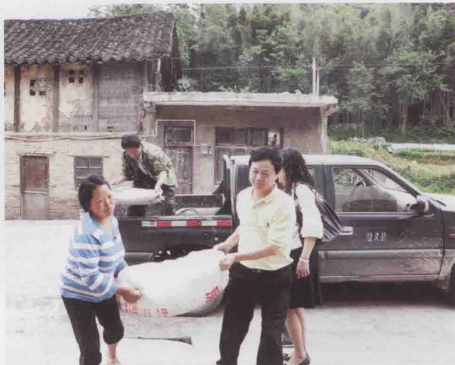
图27 遵义县编委办在西坪镇南坝村帮扶计划生育户(2010-05)