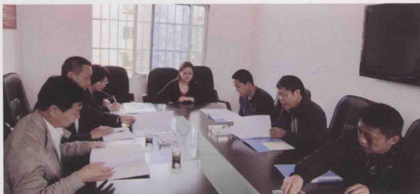
图 21 遵 义县编委办和 遵义县住建局 到贵阳市白云 区房屋拆迁征 收管理局考察 学习(2012-05)