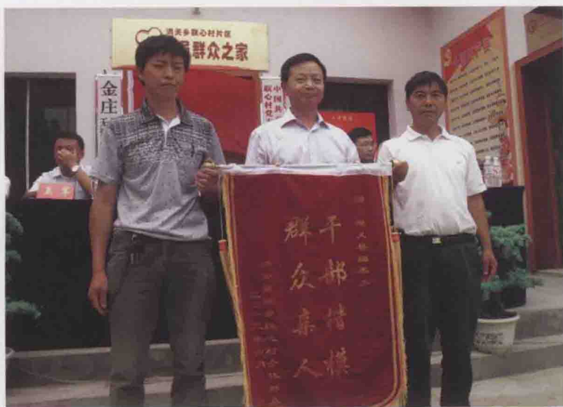
图31 遵义县编委办在洪关乡联心村开展“双亲”活动,联心村村民向县编委办赠送锦旗(2012-06)