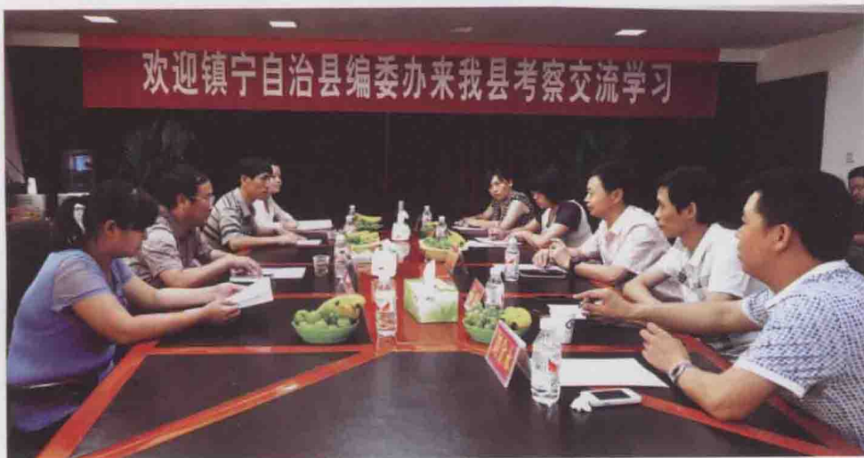
图23 镇宁县编委办在遵义县交流学习网络红页工作(2013-06)