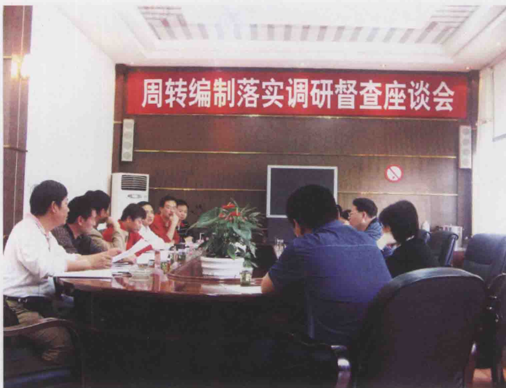
图5 中央编办在遵义县调研周转编制落实工作(2007)