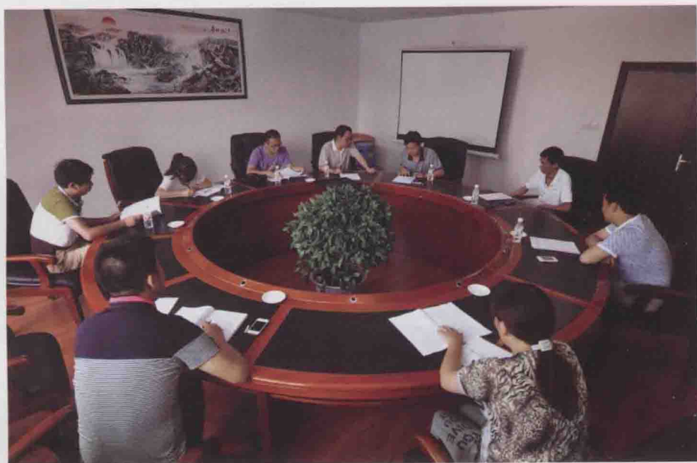
图24 金沙县编委办在遵义县交流学习事业单位分类改革和网络红页工作(2013-07)