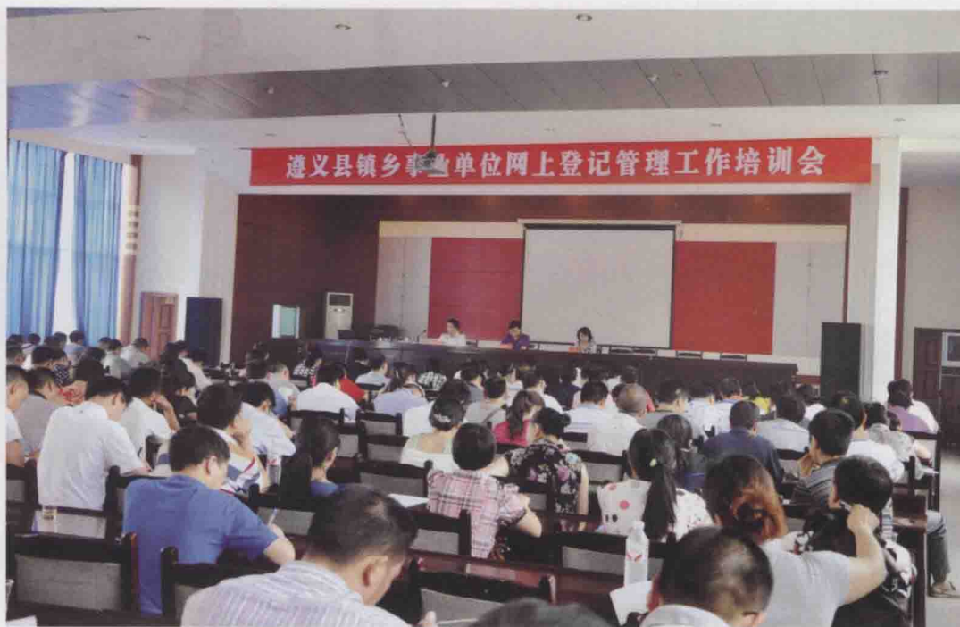
图16 遵义县事业单位登记管理局举办镇乡事业单位网上登记管理培训会(2010)