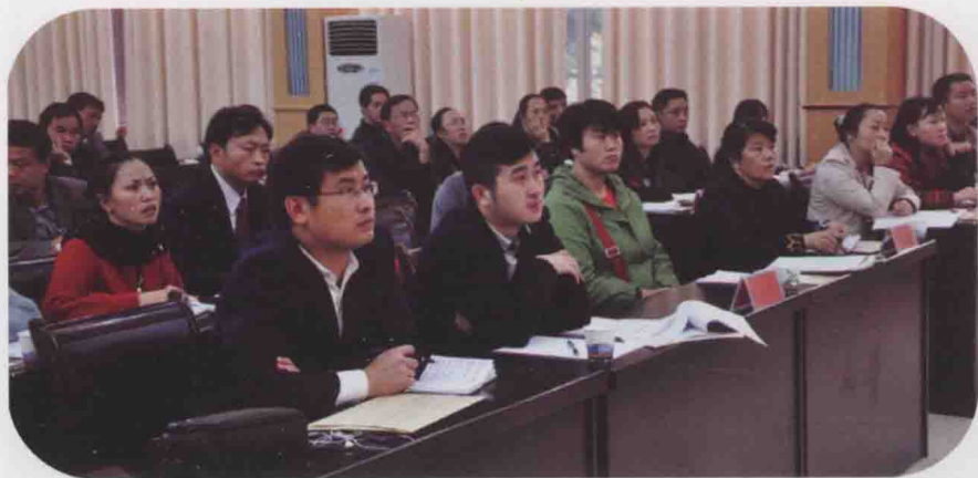
图19 中文域名和网络红页工作业务培训会(2012-11)