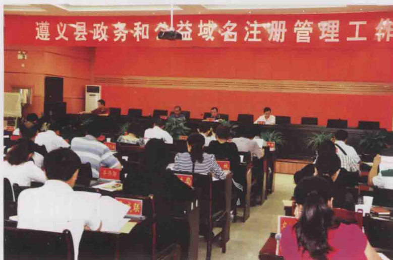
图18 遵义县召开 政务和公益机构域名注 册管理工作会(2011)