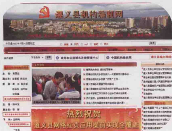
图25 遵义县机构编制网(2013-06)