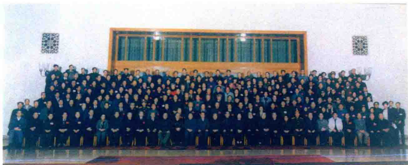
1991年全国关工委在京召开第一次“双先会”时全体代表合影（第二排围白围巾者是作者）