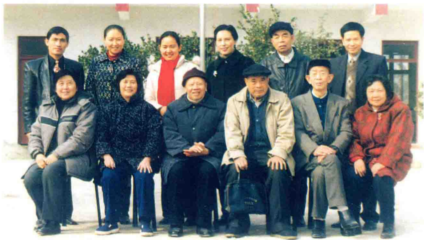
遵义市红花岗启智学校成立时合影