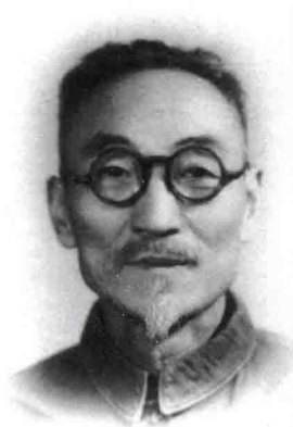
中央人民广播电台 台长刘文粟