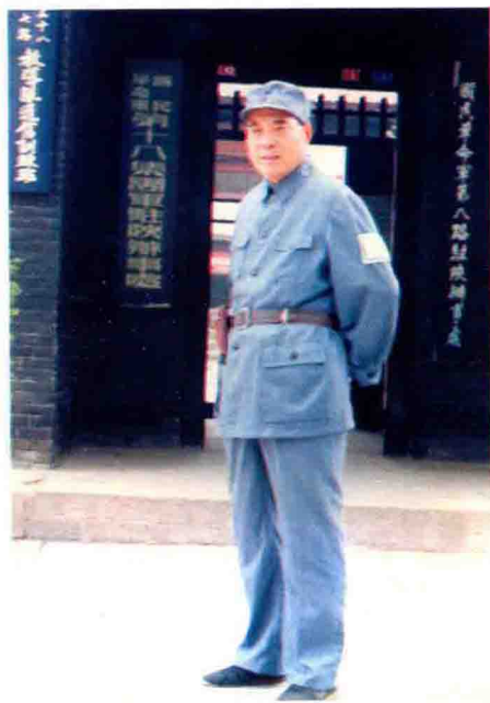
1986年作者和妻子一起去原西安八路军办事处时借装留念