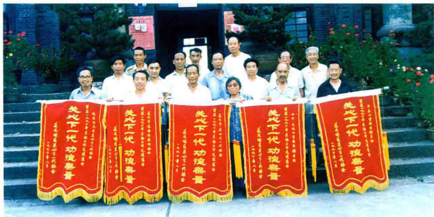
1991年作者在遵义地区关协双先会发奖时合影