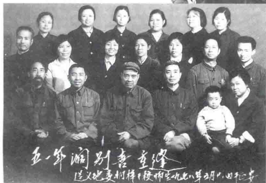
1978年，解放初期桐梓干校的部分学生在正安合影