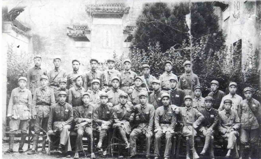
1949年江西省玉山县人民政府成立时全体南下人员合影