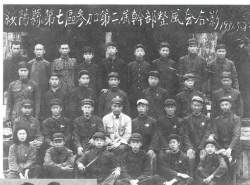
1951年绥阳县第七区第二届干部整风会合影