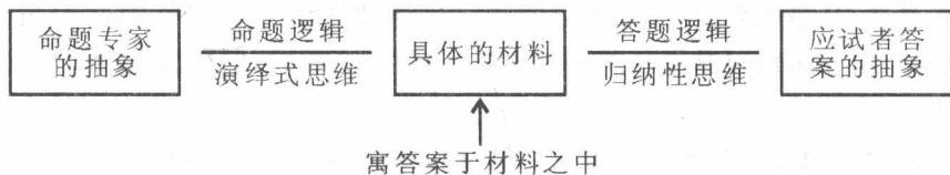
申论命题与答题的思维逻辑图

演绎是从抽象到具体的逻辑过程,归纳是从具体到抽象的逻辑过程。申论答题是从具体到抽象的归纳性思维,不是从抽象到具体的演绎式思维。申论命题和申论答题是两种不同的思维路径。