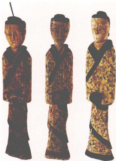
长沙马王堆汉墓出土的彩绘木俑

凤、鹿、雀各4只，共50多只动物形象，凤鸟口衔圆雕小蛇与框架浮雕小蛇相连接。画面对称而活泼，构图饱满，形象生动，用朱红、湖灰、金银彩漆描绘，绚丽夺目。建筑木雕装饰，据记载有秦代的阿房宫。汉代王延寿《灵光殿赋》写有“飞禽走兽，因木生姿”之句，则见当时宫殿建筑木雕已为人所推崇。