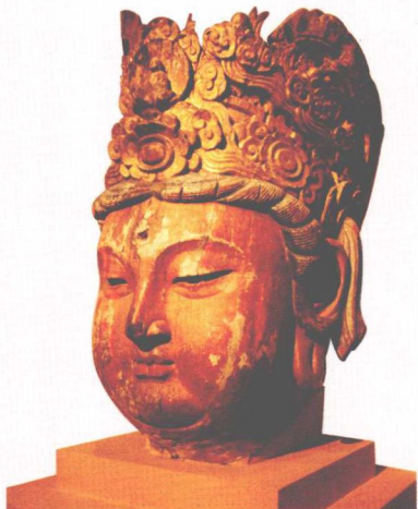
宋代木雕彩绘观音像，国家博物馆馆藏