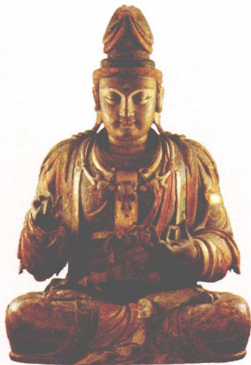
北宋彩绘木雕观音像，明尼亚波利斯艺术馆藏

唐宋时期，其他木雕工艺品也在社会生活中大量出现，如文具、木雕家具装饰、建筑屏扇、手杖把、尘尾柄、剑鞘等。雕镂精致，以瑞兽、狮、虎、龙、凤、鸟、兽等作图案，随器物形制需要进行装饰，材质多用紫檀、黄杨等优质木材，雕刻技法有雕、琢、镂、刻、剔、嵌等，刀凿并用，雕刻技艺有了进一步提高。