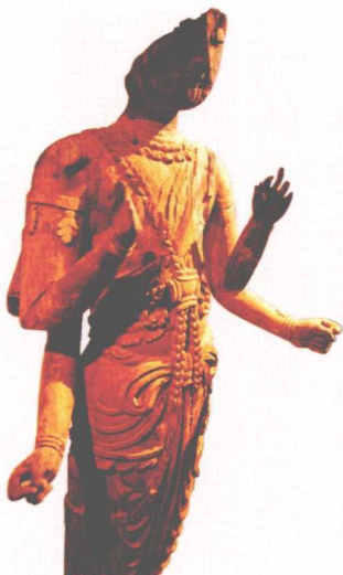
唐代敦煌木雕六臂观音像， 高 65 厘米，国家一级文物

这尊木雕六臂观音像是全世界仅存的几件唐代观音木雕像之一，具有很高的历史价值，是一件罕见的佛雕艺术精品。六臂观音，也称日月观音，它是千手千眼观音的一种，但与千手观音相比，六臂观音造像极为稀少，而木雕六臂观音造像则更罕见。