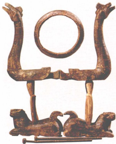
战国中期·罕见木雕兽形漆鼓架

《韩非子·显学》有“像人百万”之语，像人即俑人，多为木俑，可见当时制作木俑之盛。河南信阳长台关出土的战国俑，以木块雕出人体大形，用颜色绘五官及衣服细部，身体涂以黑漆，面与手涂红，眉、目以黑线勾描，腹部绘成珠、瑾、彩结、彩环等成组装饰物。