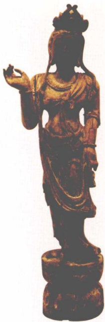
唐代木雕彩绘观音立像，抚顺博物馆收藏，国家一级文物

苏州博物馆的五代十国时期的观音檀龕，右轴善财童子，高仅 1 厘米，面孔小如米粒，形神毕肖，生趣盎然；左右两扉图像对称，上为飞天，云气飞舞，体态轻盈，下为胁侍菩萨像，与主龕观音相互呼应，雕刻精细，刀法苍劲，并有描金朱画纹饰，此乃古代木雕艺术之精品。