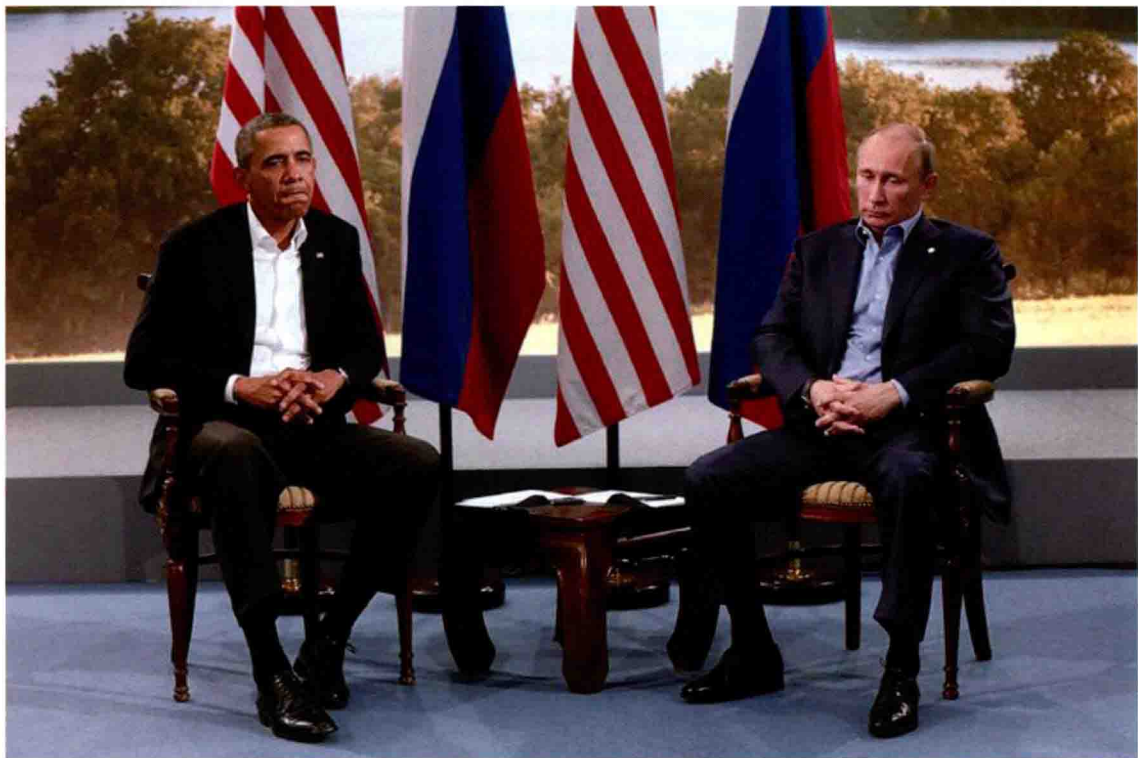
《肢体语言 Body Language》2013年6月17日，奥巴马和普京在北爱尔兰的八国集团首脑峰会上举行双边会晤。