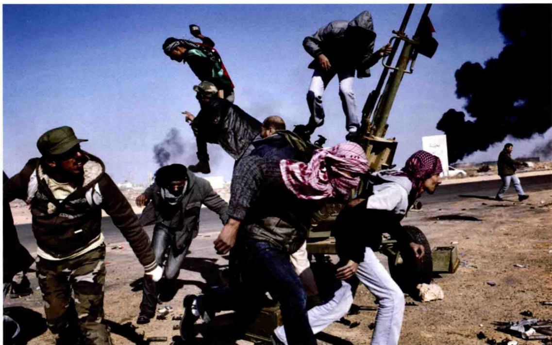
《革命道路》2011年3月11日，几个星期以来反政府武装坚持对抗利比亚领导人卡扎菲，希望全世界会来帮助他们，随着独裁者的飞机和坦克落败，他们开始重新夺回自由的利比亚。