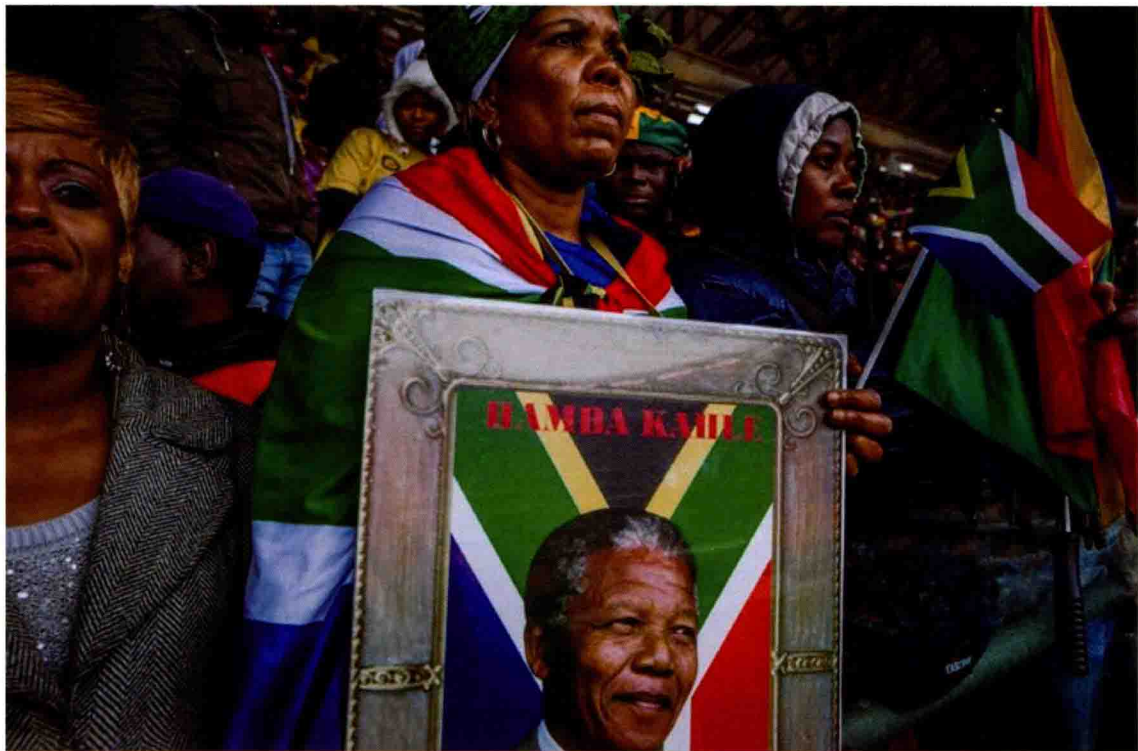
《悼念曼德拉》2013年10月10日，人们捧着曼德拉的相片在南非约翰内斯堡体育场悼念曼德拉。

新闻摄影之所以是纪实摄影的一种类型，是因为两者都具有纪实性、真实性。但通常情况下人们将纪实摄影与新闻摄影看做是并立的两个概念。一幅照片通过大众传媒成为所谓“新闻摄影”，它必定是具有一定重要性的，会产生一定的社会影响力。况且今天是新闻，明天就将成为历史，经过时间的锤炼也就成了历史的文献资料，这就符合了纪实摄影的特征。因此，我们也不能单方面地把纪实摄影和新闻摄影割裂开来。