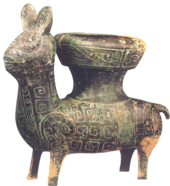
春秋酒器牺形铜尊