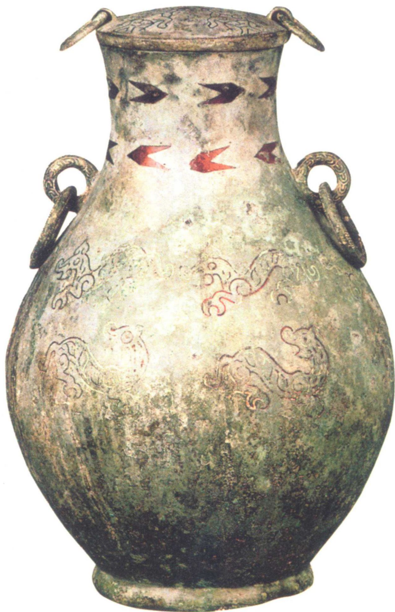
春秋盛酒器鸟兽纹铜壶