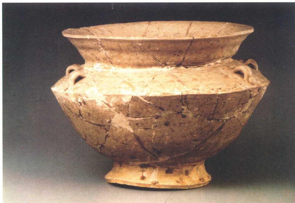
西周盛酒器四系青瓷尊