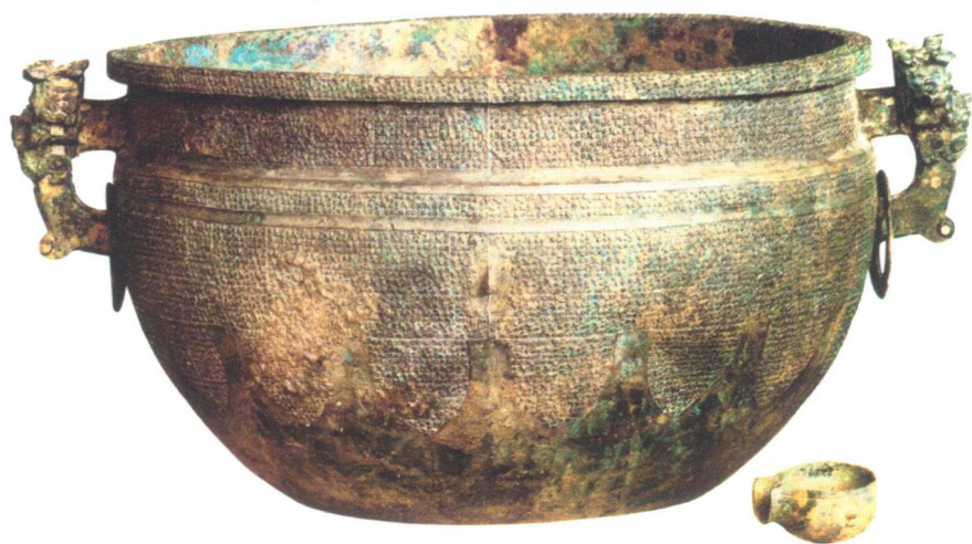
春秋盛水器吴王光鉴