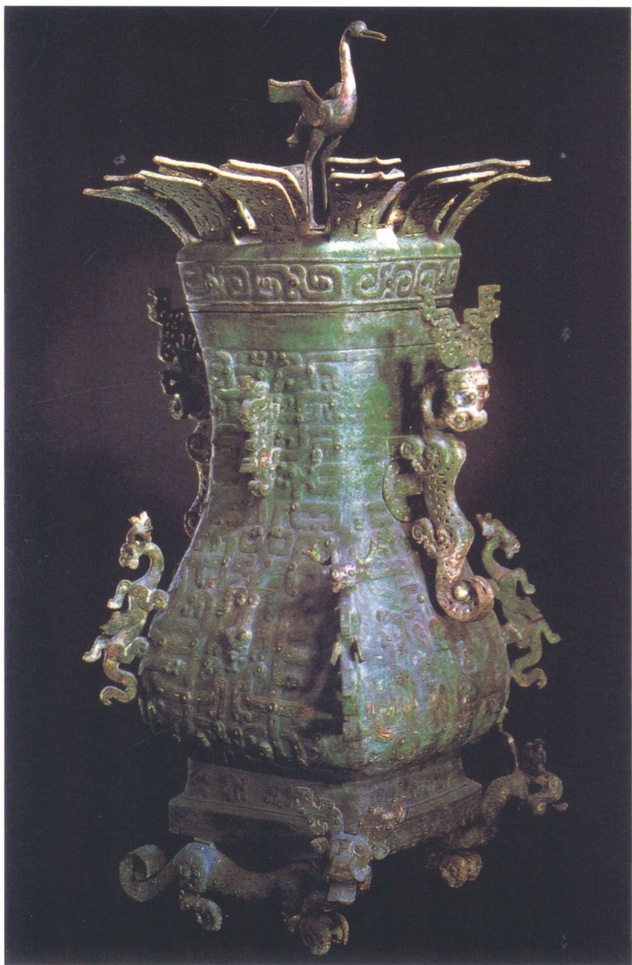
春秋中期青铜莲鹤方壶