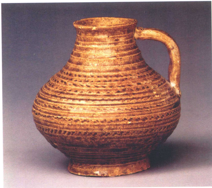
西周盛水器原始瓷壶