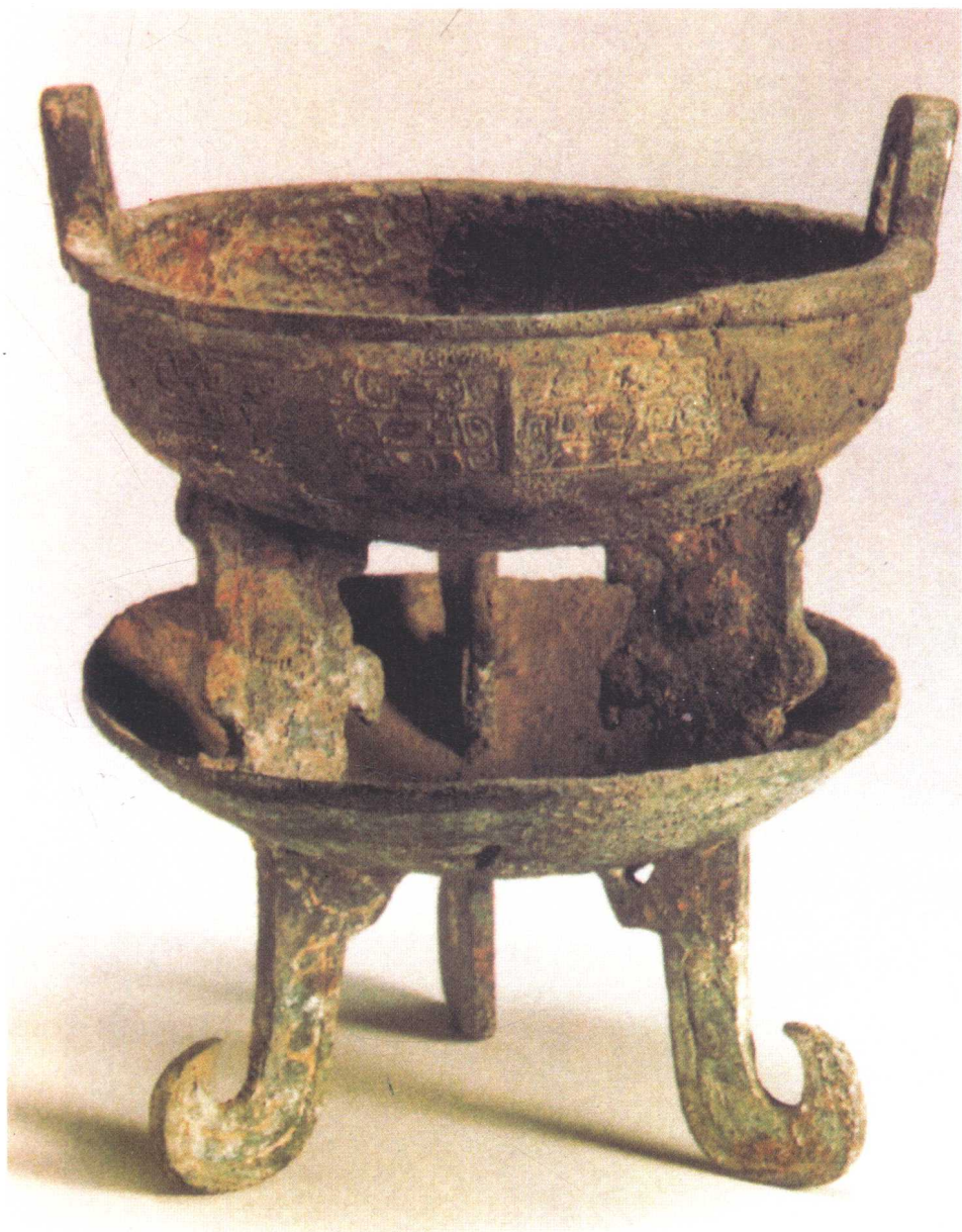
西周青铜托盘夔足鼎