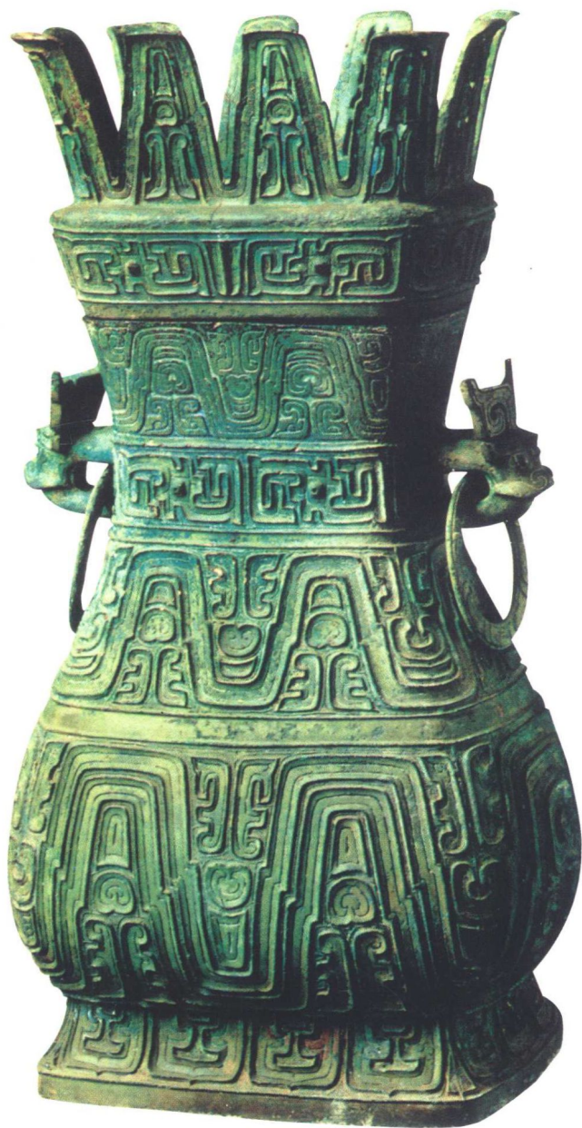
春秋盛酒器曾仲游父铜壶