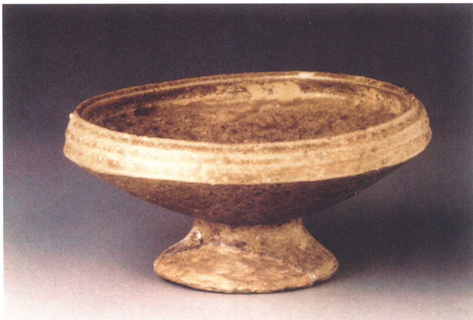
西周盛食器原始瓷豆