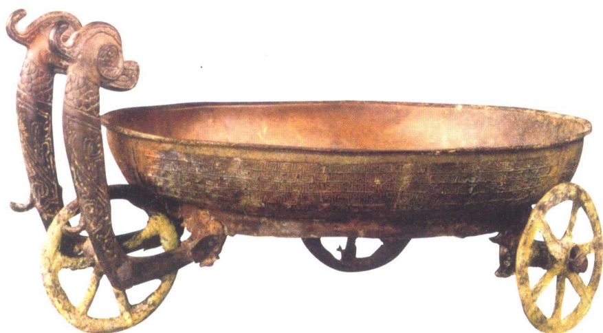
春秋盛水器三轮铜盘