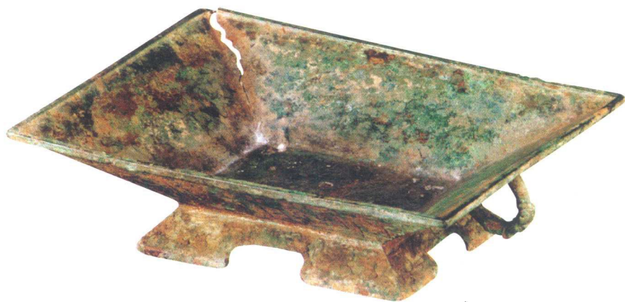
春秋盛食器薛子仲安铜簠