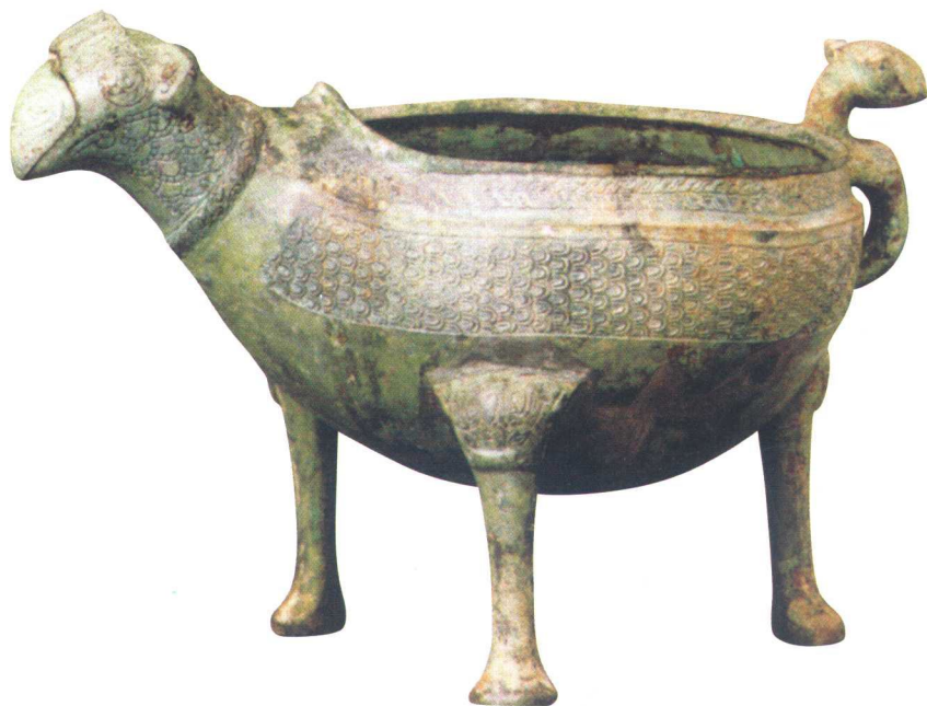
春秋炊器鸟形铜鼎