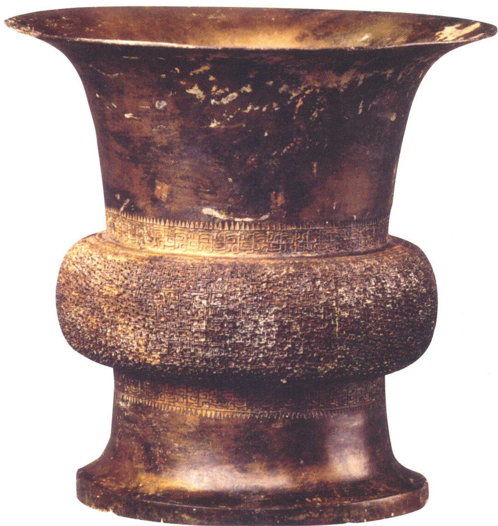
春秋盛酒器铜尊壶