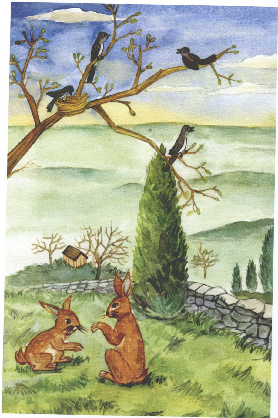
忐忑和憧憬是离家前交织着的两种心情