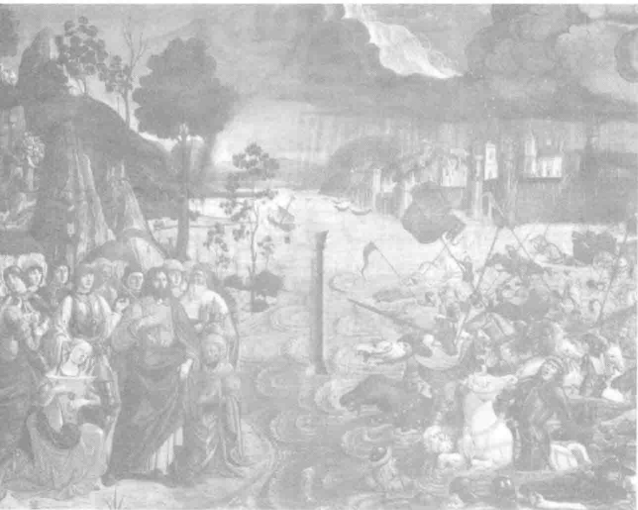
《摩西的生活之渡过红海》

事实上，许多宗教由于受到多神教的桎梏，并不能形成一个明晰的意象。相应地，人类的信仰也不能简单地归结为是严肃情感的产物，尽管严肃的态度是宗教和道德本身的主要成分。例如印度的婆罗门教，几乎全靠一种极强的保守性才得以延续至今；佛教西传以失败而告终；德鲁伊特教始终都只是本土的国教，也并没有成为全世界的信仰；希腊的俄尔普斯主义及其宗教改革尝试，也并没有帮