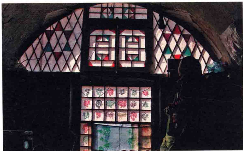
安塞一带的花窗

榆林地区西部的靖边县、定边县、安边镇的剪纸，因其纤细入微、小巧玲珑，抖出的“毛毛”细如针尖，剪出的线条密如发丝，玲珑剔透，统归“三边剪纸”类型。这里的剪纸，外轮廓承传了延绥剪纸粗犷、简练、抽象的造型特点，在内部装饰上又有江南剪纸的工巧细腻。