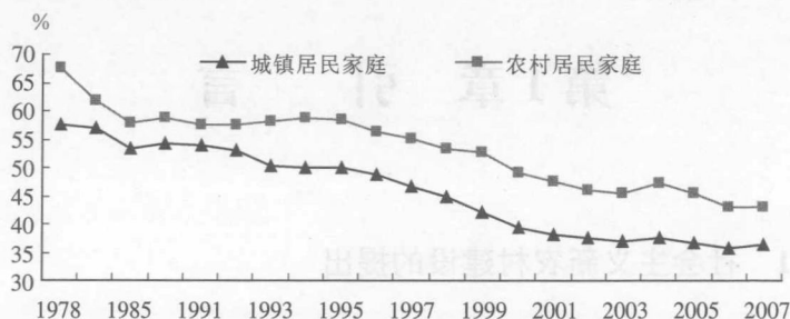
图 1-1 城乡居民家庭恩格尔系数