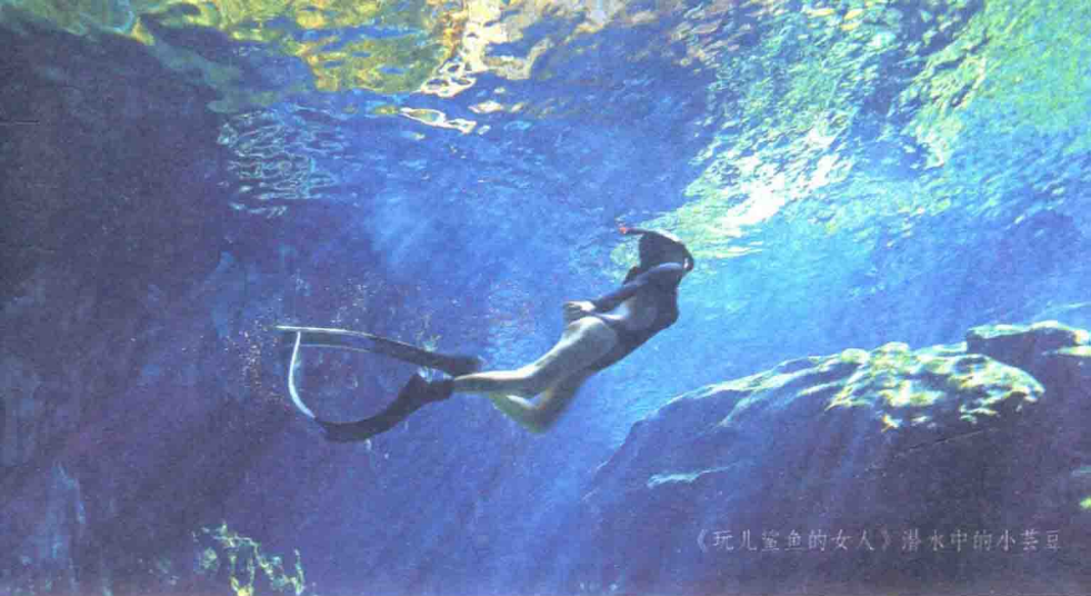
《玩儿鲨鱼的女人》潜水中的小芸豆