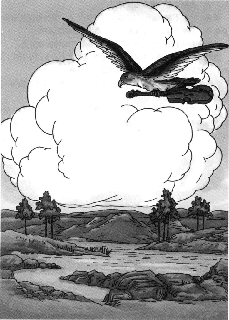
鹰带了梵哑铃向地下飞