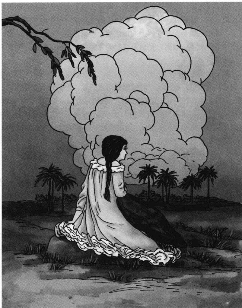
她遥望地平线等待黑夜到来

来的时候，她嚷道：“夜来了，夜终于来了。”于是她闭了眼睛，在这棵高大的棕树下睡着了。