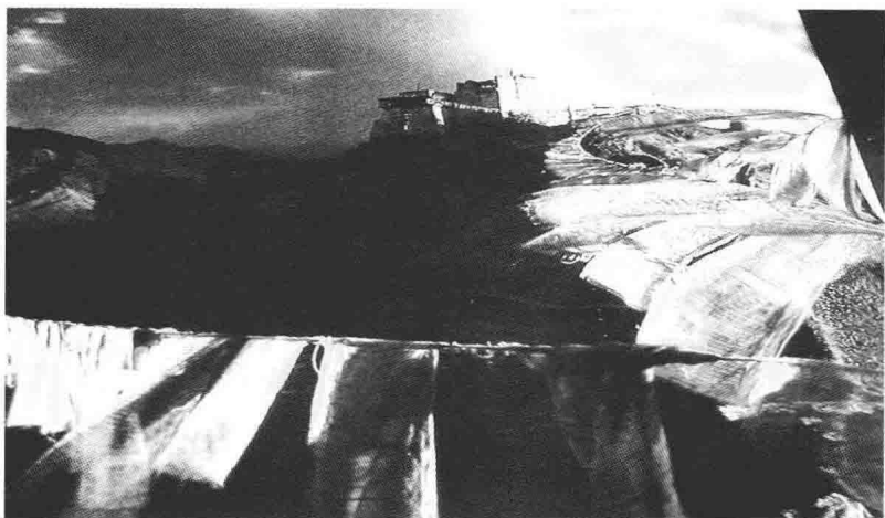
神庙与经幡（在世界峰巅，人能聆听灵魂的罡风在劲吹）

如何调整情感；当碰到有亲朋好友死亡时，又如何去帮助他们的家人调适情绪；等等。第四，在价值层面，死亡教育的目的就是要树立正确的死亡观。具体地说，就是获得正确的有关死亡及生命的自我意识与价值观，能理性地、合乎逻辑地思考和面对生死问题，让自己的心灵获得安顿。禁忌、逃避、冷漠、恐惧死亡，都不能将“死亡”变成不存在，乃至影响到生命教育。