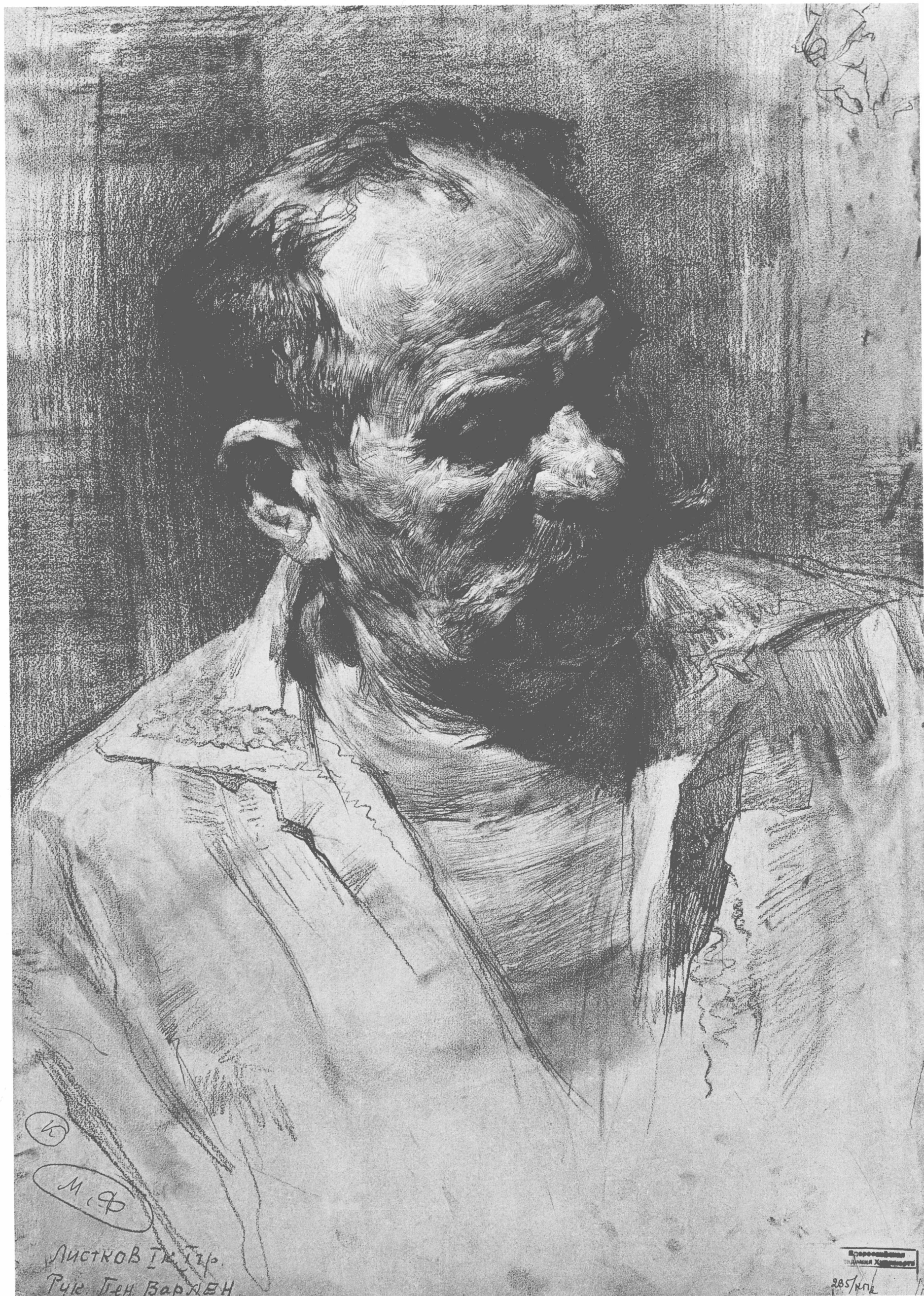
老人头像 列斯特阔夫