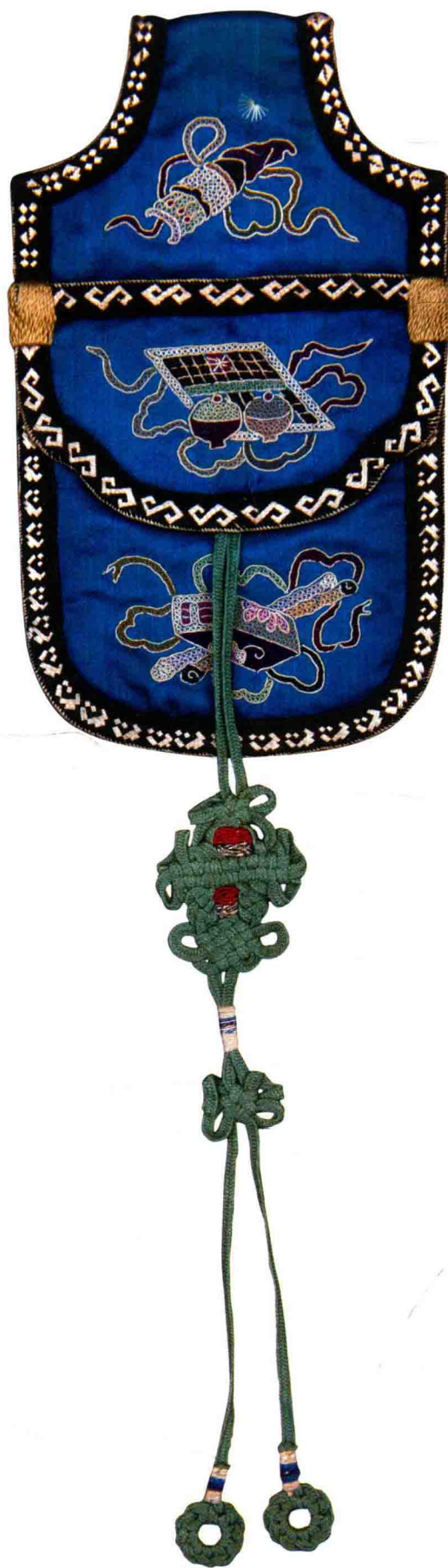
二式打子绣与拉锁绣钱荷包