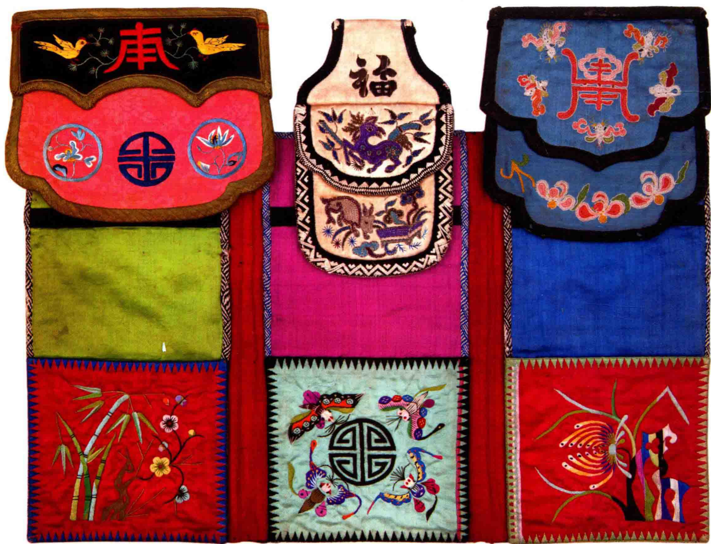
三式钱荷包与靴掖