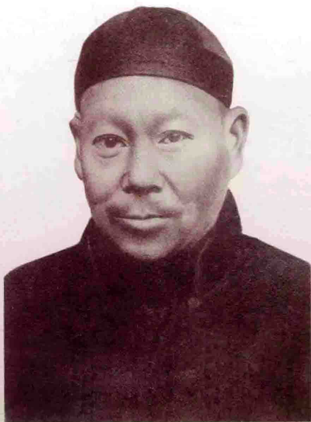
山西常有心意六合拳祖师李复楨 (1855~1930年)