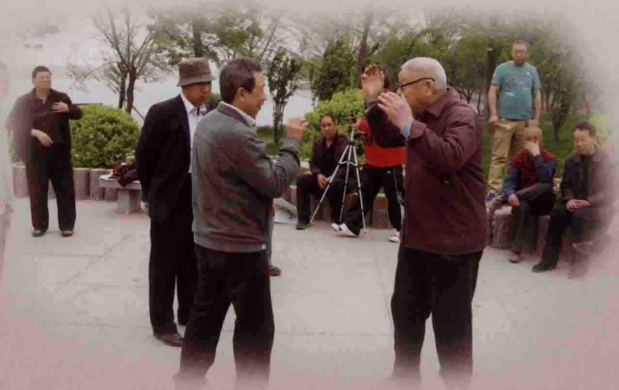
程根科师父与弟子们练功照