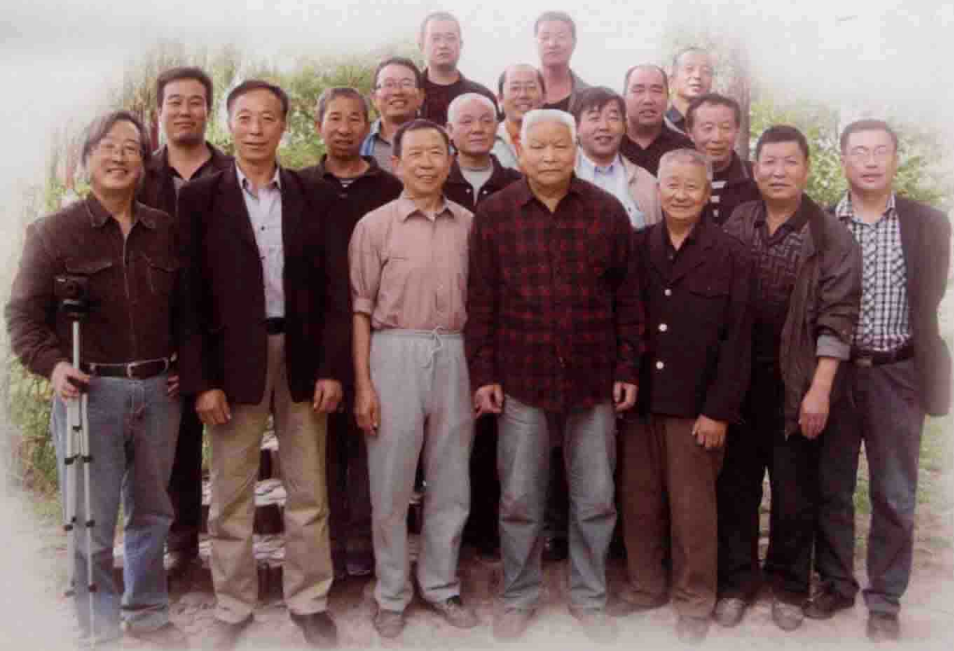
山西常有心意拳协会合影