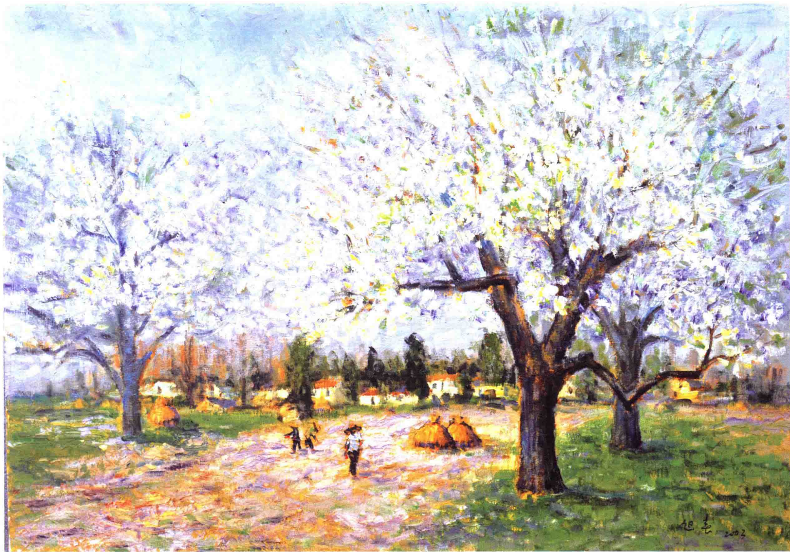
2002 · 花满枝头 80×120cm