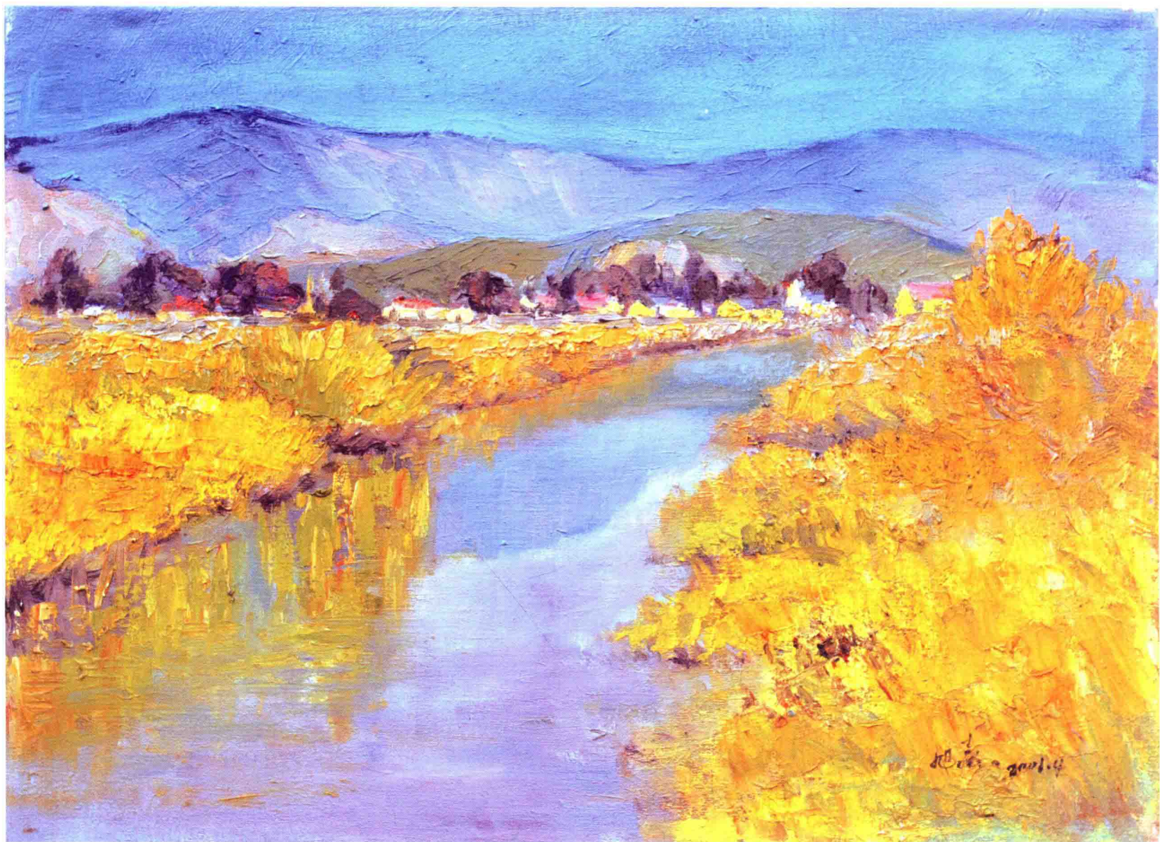
2001 • 溪满树黄 46×60cm