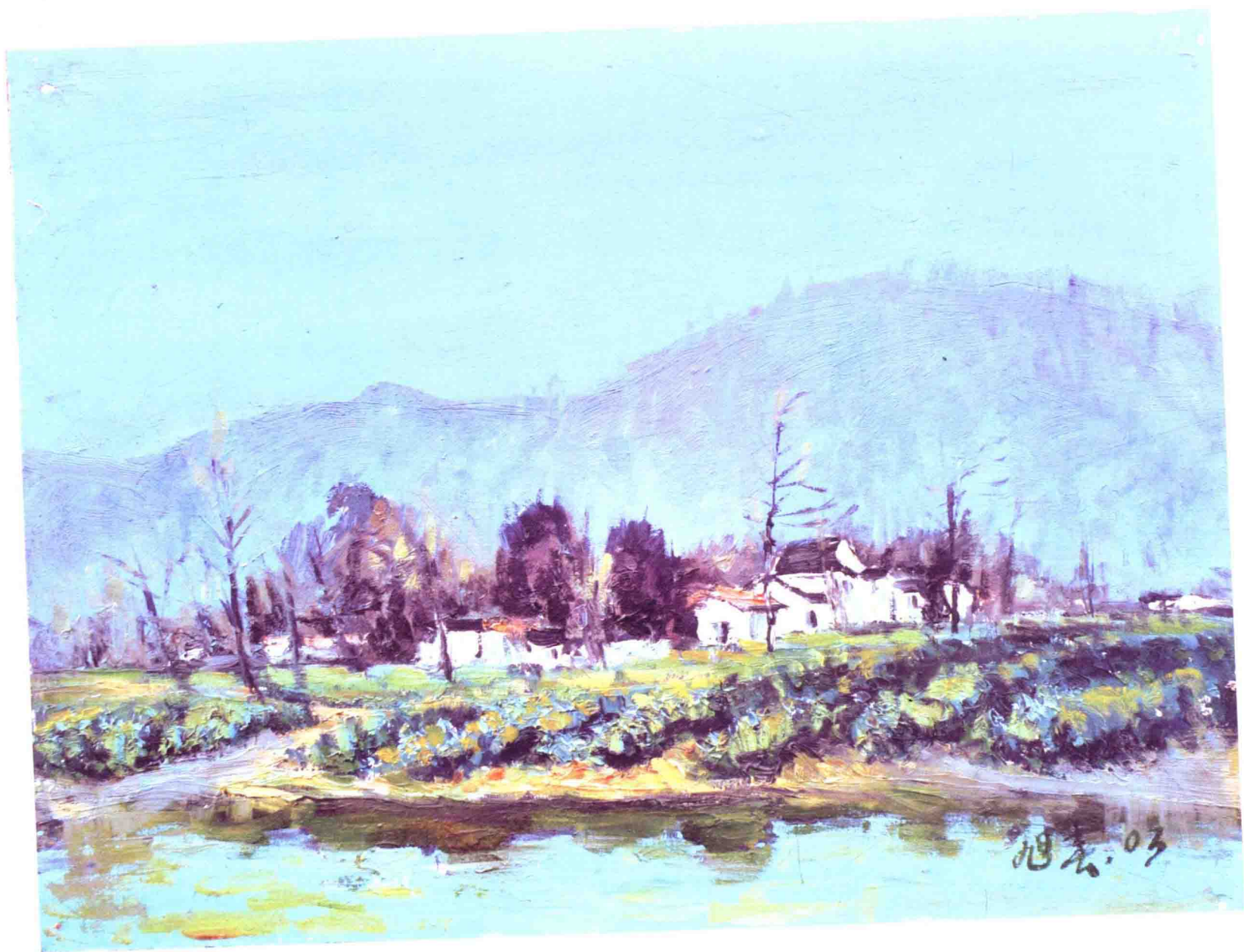
2003 · 蓝天碧水 46×60cm