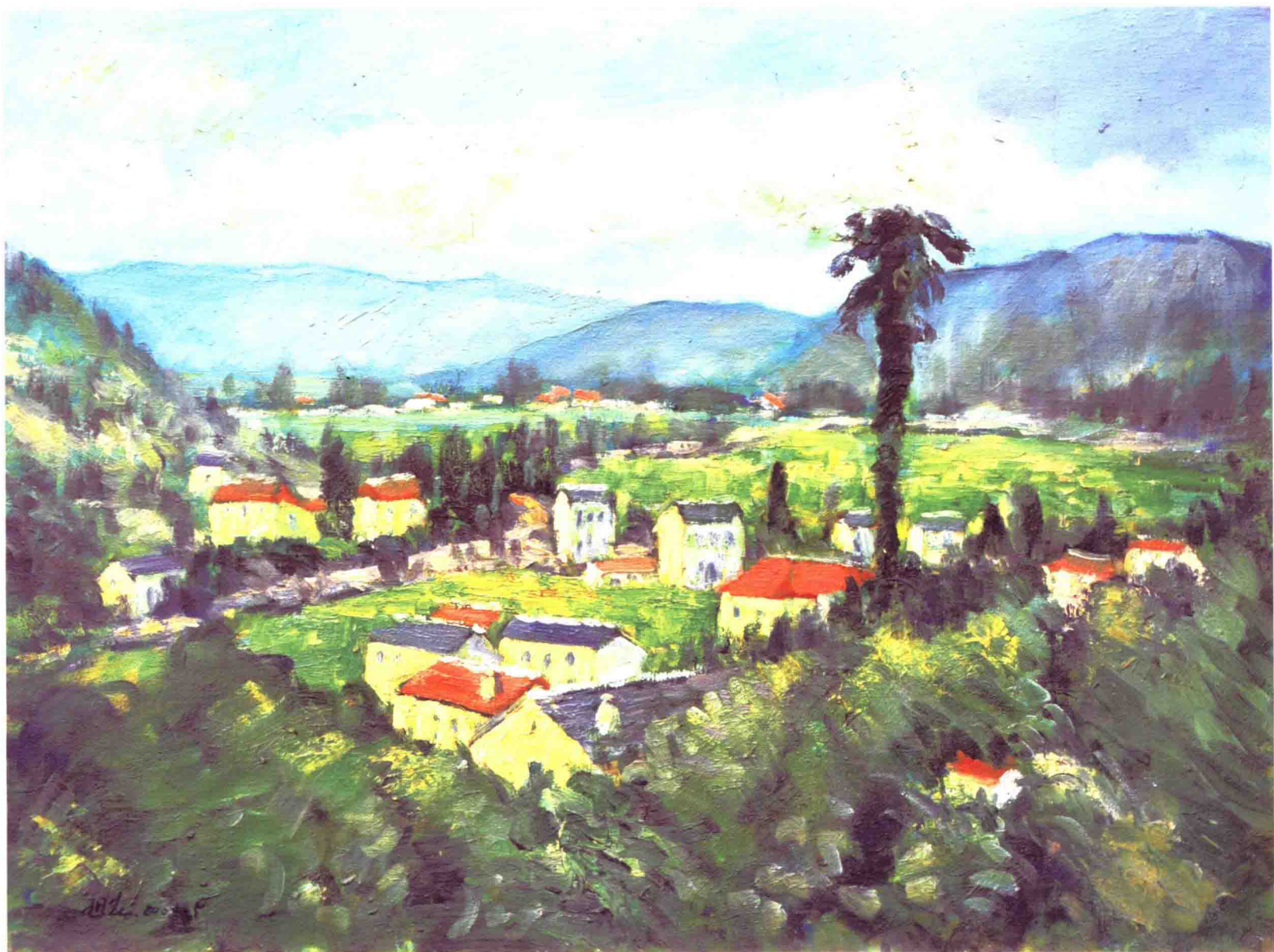
2000 · 白云底下 60×80cm