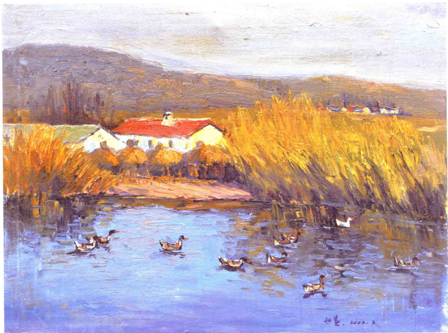
2002 · 恬静乡村 46×60cm