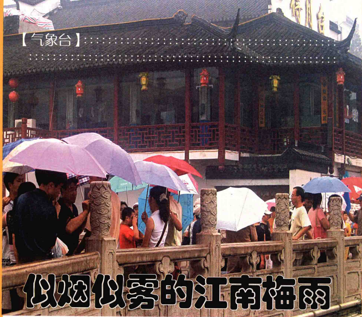
▲雨中游览南京夫子庙