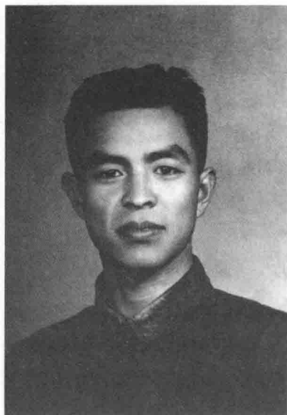
(上) 青年时期的褚时健。