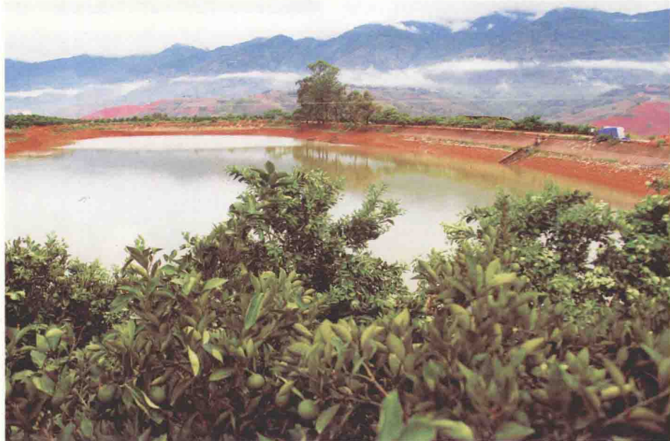
(上) 红塔集团办公楼。(下) 夏日的雨后，橙园云雾缠绕，清新净爽，令人心旷神怡。