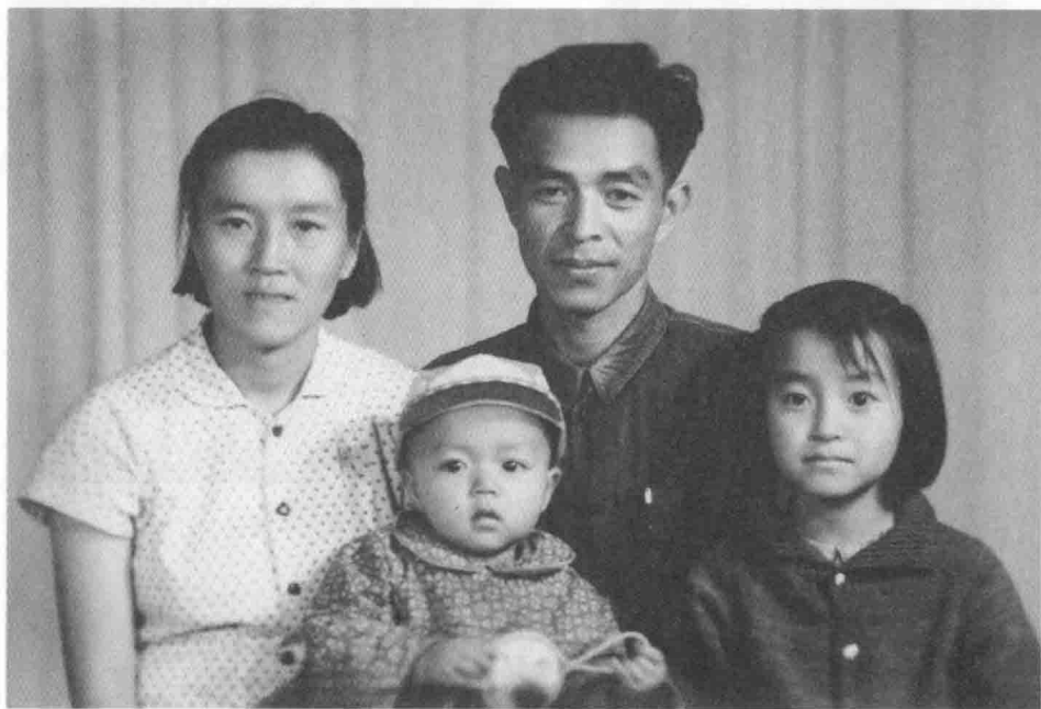
(下) 褚时健夫妇与一双儿女合影。