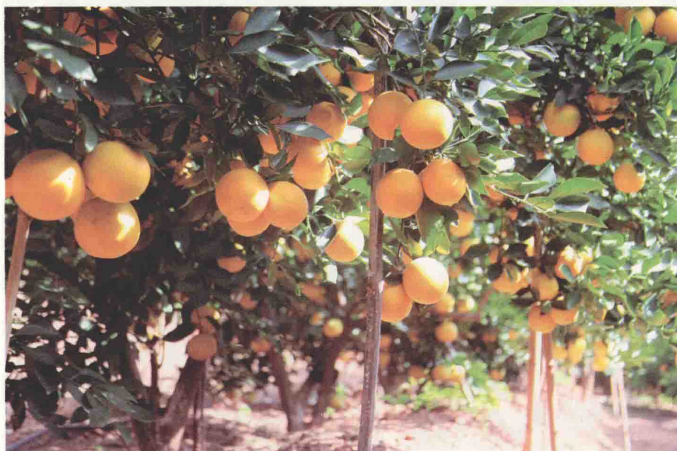
(上) 褚橙庄园全景。(下) 硕果累累。