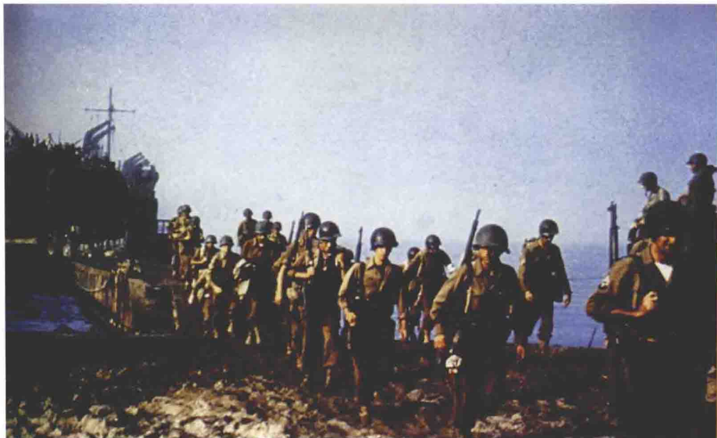
■ 美国坦克登陆舰LST-1在萨勒诺登陆期间输送陆军部队上陆。注意从登陆舰到陆地间的一段由175英尺长的浮桥连接，因为海滩较浅容易使登陆舰搁浅，这些浮桥在登陆舰航行时装载在其两侧。