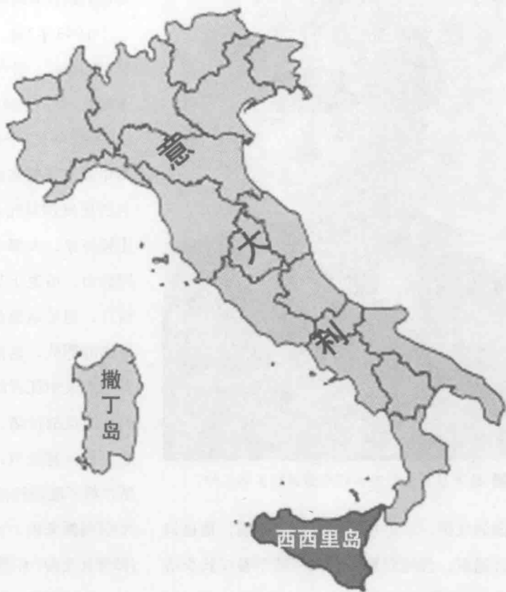
附图一 西西里岛方位图

里岛、撒丁岛、科西嘉岛和本土担负防御的为44个师又6个旅，163艘舰艇和600架飞机。德军在意大利部署了7个师又2个旅，60余艘舰艇和500架飞机，由南线总司令凯塞林元帅统一指挥。