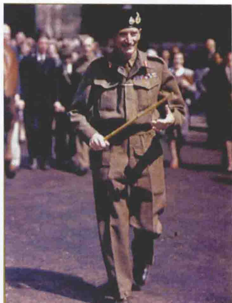
■ 英国第8集团军司令蒙哥马利将军。