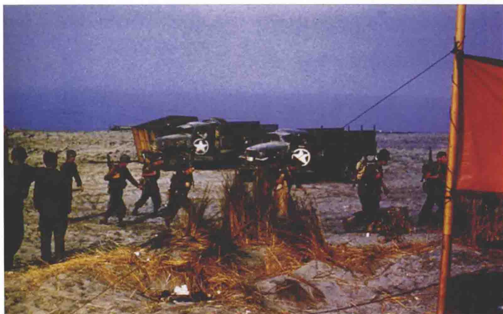
■ 萨勒诺登陆滩头一瞥，注意美军卡车门上大大的带圈的国籍标识。