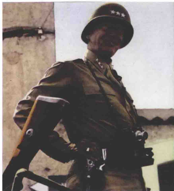
■ 美国第7集团军司令巴顿中将。