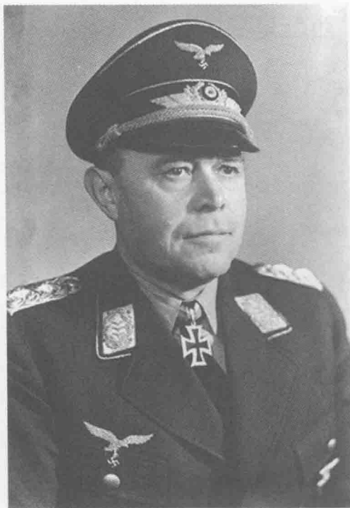
■ 德军驻意大利部队的总指挥凯塞林元帅。

国的庇护。不过在严峻的现实面前，他也只好屈服，最终同意了意大利陆军参谋长罗塔上将的建议，接受德国更大规模的支援，不过为了仅存的一点点面子，墨索里尼坚持在意大利的德军战术上必须由意大利方面来指挥。