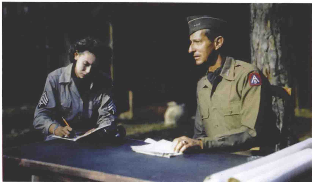
■ 美国第5集团军司令克拉克中将是意大利战场美国地面部队总指挥。本照片摄于意大利战场的指挥部，左边为其漂亮的女秘书。