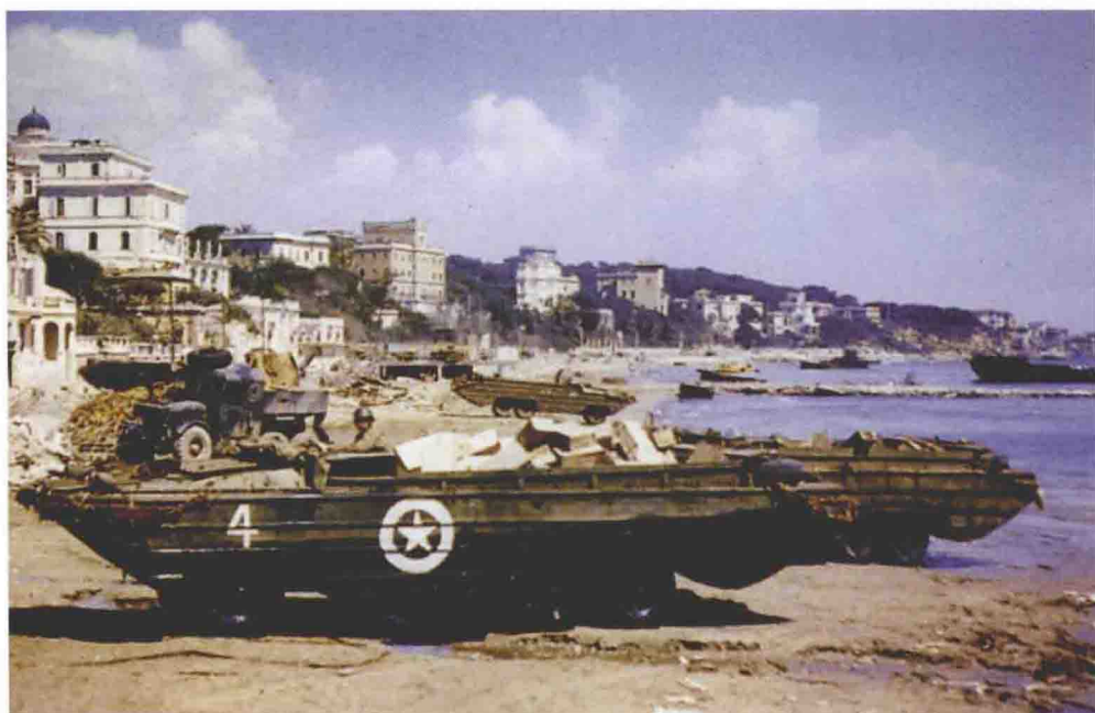
■ 安齐奥登陆时美军将物资分成小批用DKW两栖运输车送上岸，这大大减少了德军炮火使所有物资损失掉的危险。