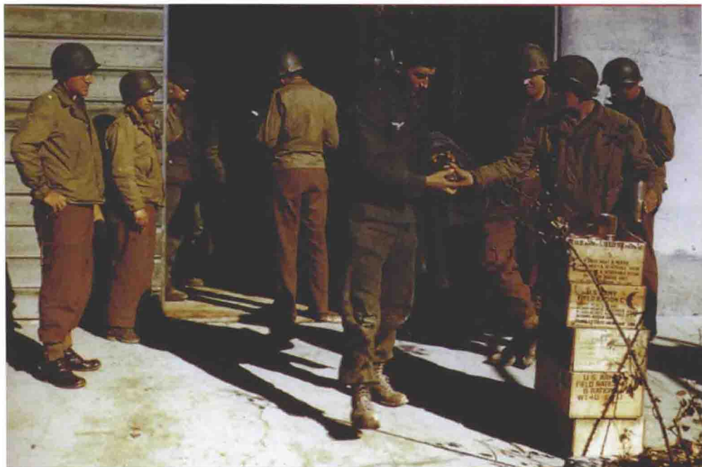
■ 在安齐奥被俘的德军士兵被发放足够的口粮让他们离开滩头。图中是一名德军伞兵，他分配到了2罐口粮，其中有1罐是肉和蔬菜，还有1罐是饼干、巧克力和咖啡。