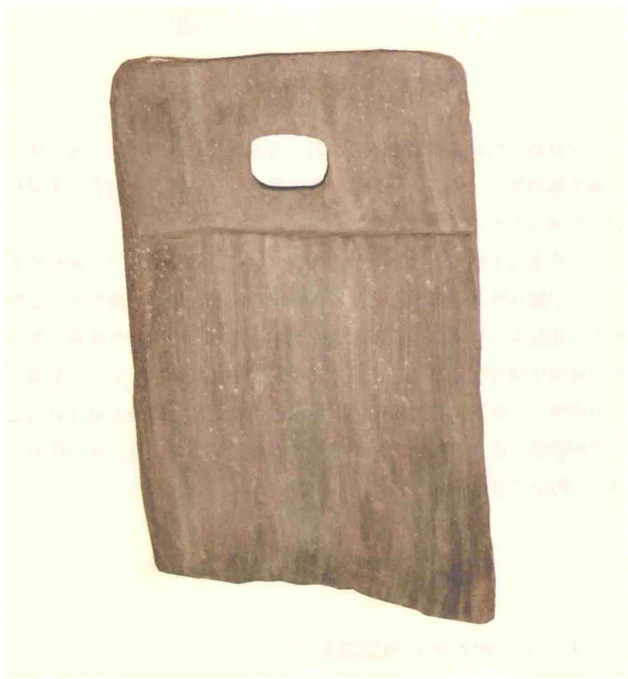
图1-1 河姆渡时期的平身柱柱头榫

宁波地区的文化起源于7000多年前的河姆渡时期，河姆渡时期的榫卯工艺、雕刻工艺、髹漆工艺和装饰思路都成为宁式家具设计思想产生的起源（见图1-1）。