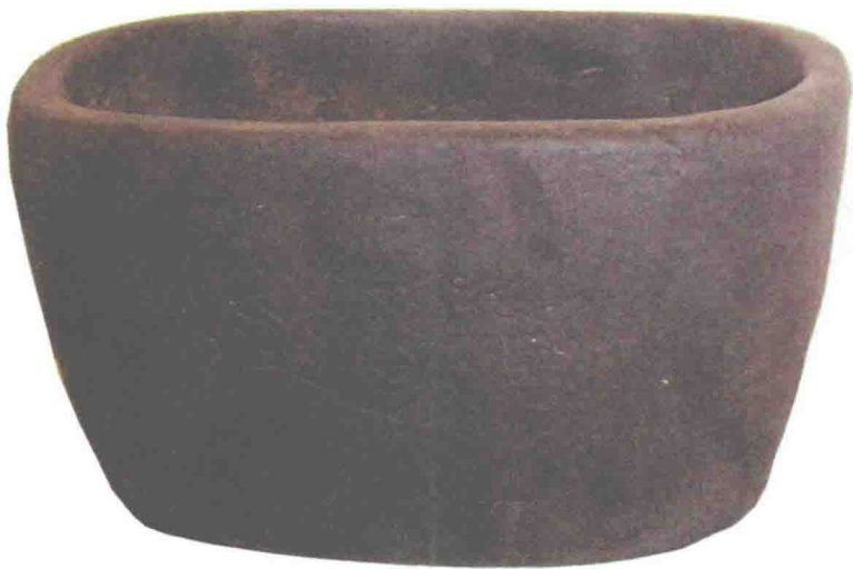
图1-8 宁波余姚河姆渡出土的猪纹方钵

匕柄上便刻上编织纹；纺轮用于旋转，上面则施以弦纹、旋转纹；角质斧柄用于拿握，为增加摩擦，也为美观，阴刻人字纹。除了在陶器上进行刻画装饰以外，河姆渡人还在一些陶器的表面进行绘画创作，这类陶器大多制作精细，造型美观。绘画的题材也极为广泛，大自然的花草树木、飞禽走兽均被纳入创作的范围。这些作品线条流畅、笔法简练，而又生动形象、情趣盎然，表现了作者对大自然细致入微的观察和对美好生活的礼赞。鱼藻纹盆、稻穗纹盆、猪纹方钵（见图1-8）、五叶纹陶块等作品，都是河姆渡文化灿若群星的陶器装饰艺术品中的佼佼者，反映河姆渡人祈求农业丰收、畜牧兴旺的美好愿望。