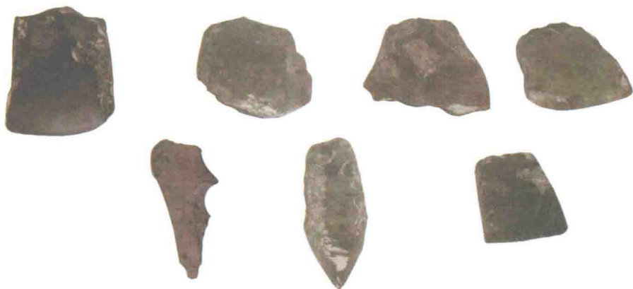
图1-6 河姆渡时期制作木构件用的工具——石凿、骨凿、石斧