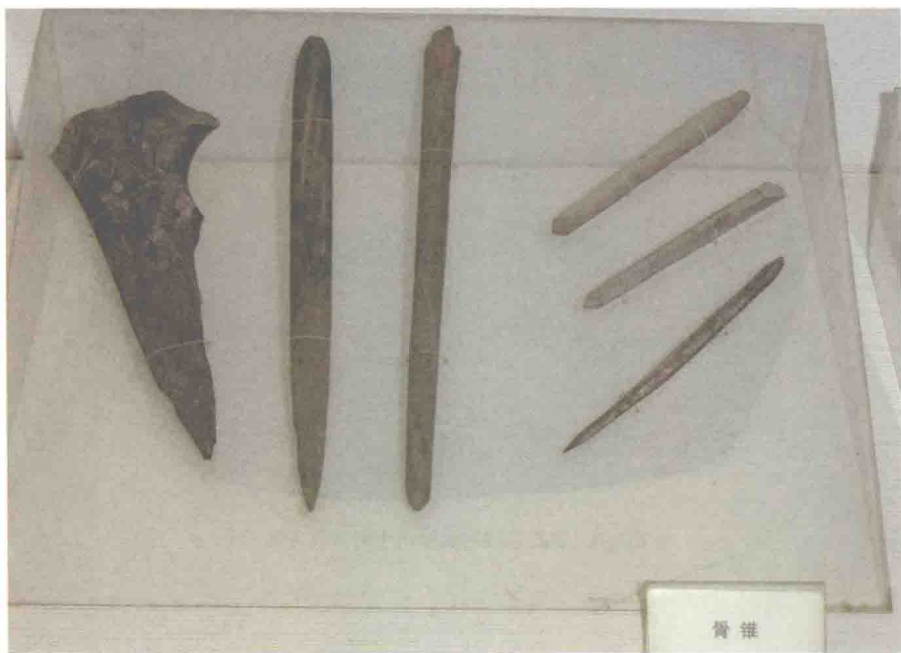
图1-7 河姆渡时期的制作工具

动植物形象和几何纹图案相结合的器物装饰，在河姆渡文化中的生产工具、生活器具上无处不有。在陶器、木器、骨器上可以见到整齐的刻花纹、几何纹，庄重大方、刻工精细（见图1-7）。大量器物上的装饰图案，多与该器物的功能和用途有关，如骨匕常用于织布打纬，骨