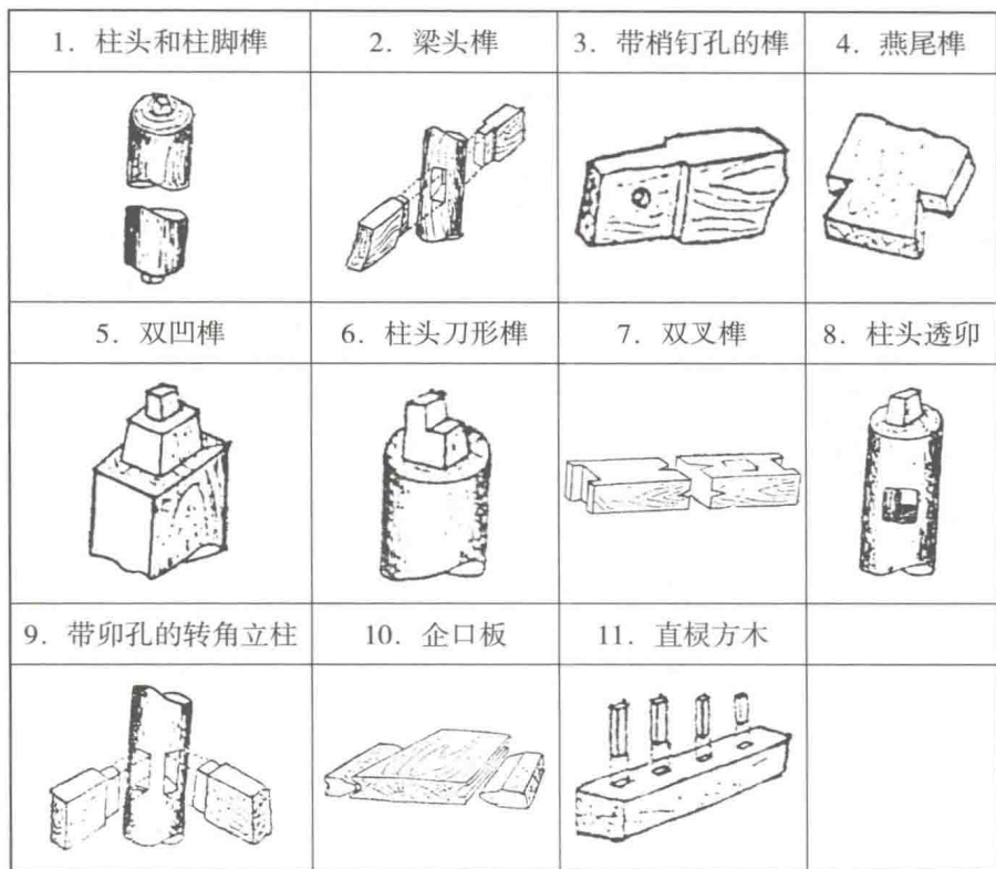
图1-4 河姆渡时期的榫卯示意图