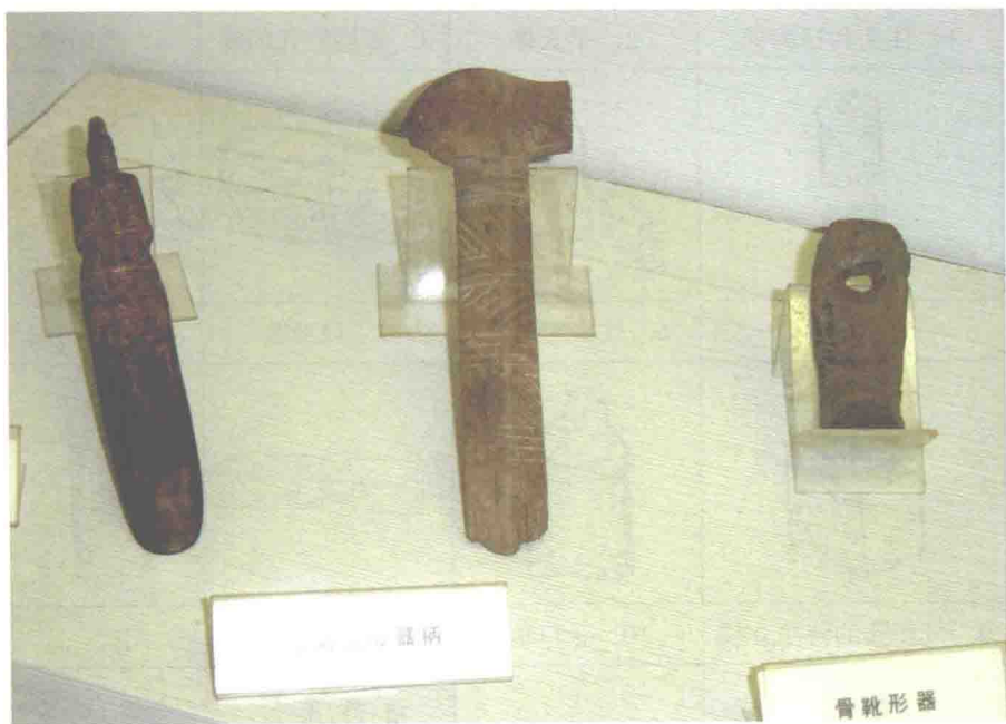
图1-5 河姆渡出土的木雕刻件