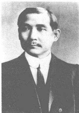
◎在南京就任临时大总统时的孙中山

以孙中山为代表的资产阶级革命派,努力用革命手段来实现自己的纲领。1911年10月10日,武昌起义爆发了。由于这一年是中国的辛亥年,所以由此引发的这场革命被称作“辛亥革命”。1912年元旦,中华民国宣告成立,建立了以孙中山为临时大总统的南京临时政府。