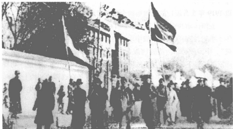
◎1919年北京爆发五四反帝爱国运动,图为北京大学学生向天安门广场集中。

迫于人民群众的强大压力,北洋政府不得不于6月10日释放被捕学生,并宣布罢免曹汝霖、章宗祥、陆宗輿。6月27日,旅法华工、留学生、华侨数百人前往中国政府总代表陆征祥所住的医院,要求拒签和约。第二天,中国代表终于未敢出席巴黎和约的签字仪式。五四运动的直接斗争目标得以实现。