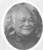
国医大师李济仁 亲自审定