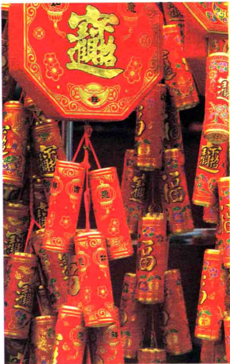
■ 春节装饰品之鞭炮

除夕 是我国传统节日中最重大的节日之一。指农历一年最后一天的晚上，即春节前一天晚，因常在农历腊月三十或二十九，所以又称该日为年三十。一年的最后一天叫“岁除”，那天晚上叫“除夕”。除夕人们往往通宵不眠，叫守岁。