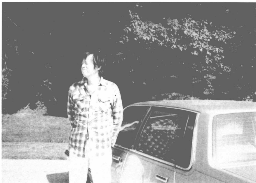
1987年驾车全美旅游途中