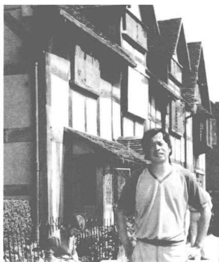
1986年在英国莎士比亚故居前