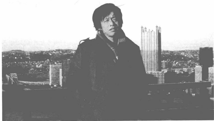
1980年代在匹兹堡大学