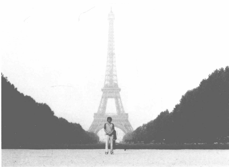
1986年在巴黎埃菲尔铁塔前