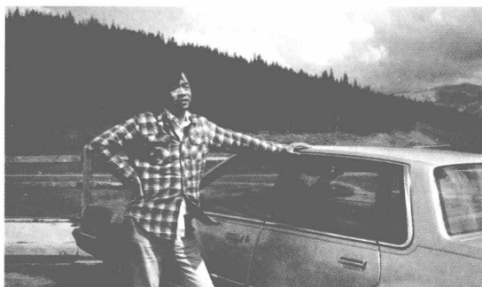
1987年驾车全美旅游途中