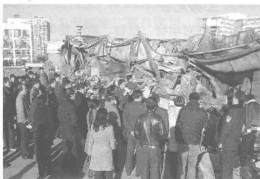
图 1-4 火灾后的现场图片

【案例三】 危险化学药剂管理不善引发火灾——2011年10月10日中午12时50分左右，位于长沙市的某大学化学化工学院理学楼发生火灾（如图1-5所示），起火建筑始建于1960年，建筑结构为砖木结构，顶层基本被烧毁，殃及几个重点实验室，火灾过火面积约 790\text{ m}^2 ，火灾直接财产损失42.97万元，未造成人员伤亡。在火灾现场，该校一位姓聂的老师说：“这场火，烧掉了不少人的心血。”另一老师放声大哭，“十余年的科研数据付之一炬”。据湖南省消防总队通报，该学校化学化工学院对实验用危险化学品药剂管理不善，没有对未使用完的药剂进行严格管理，未将遇水自燃药剂放置在符合安全条件的