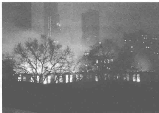
图 1-1 动力楼火灾现场图片

白发苍苍的老师用“无法估计”来形容损失，“光是建筑设计院在四楼的设备，就值上千万元；还有那些没来得及抢救转移的研究成果、软件、设计文档、论文资料，这些更是宝贵，多少钱都买不来的。”据调查，此次大火系电源导线短路引发。