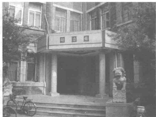
图 1-2 火灾前的动力楼图片

【案例二】 酒精遗洒引发火灾——2008年11月16日21时35分，位于北京市海淀区的某大学东校区南门附近的食品科学与营养工程学院大楼（高四层）楼顶一临时实验室（主要用于动物实验）突然起火，在大风作用下，火势迅速蔓延，难以控制，校方报警求助。14辆消防车赶到现场，经过两个小时的紧张扑救，火患才彻底解除（如图1-3、图1-4所示）。此次火灾过火面积约 150\text{ m}^2 ，实验室内放置的设备和仪器基本被烧毁，所幸无人员伤亡。据调查，此次大火系该校一名2007级博士生在实验室使用酒精灯时不慎将酒精遗洒，引燃周边可燃物导致楼顶实验室突然起火。