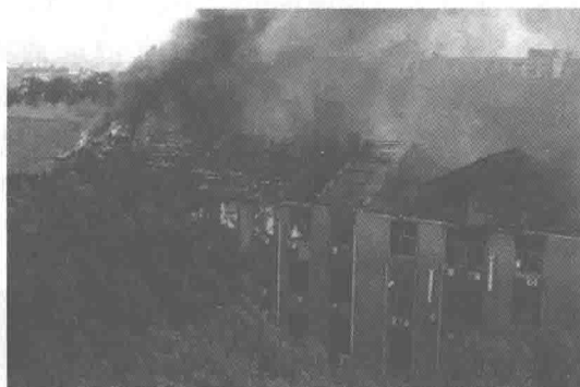
图 1-5 化学化工学院火灾现场图片

储存场所,是导致火灾发生的直接原因。起火建筑物为砖木结构,屋顶为木质材料,建筑耐火等级低,是导致火灾迅速蔓延的主要原因。