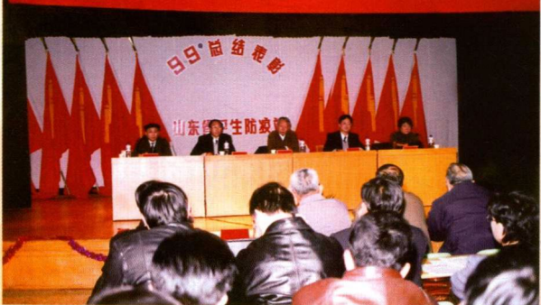
▲ 1999 年度工作总结表彰大会