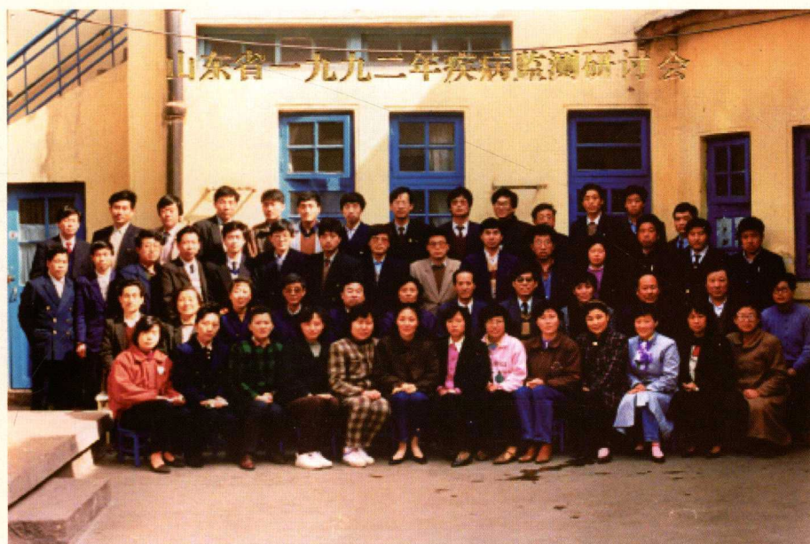
◀ 1992年山东省疾病监测研讨会