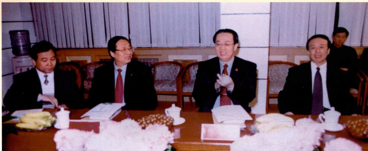
▲ 2000年4月，山东省副省长邵桂芳来山东省卫生防疫站视察