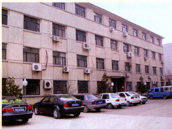
▲ 原山东省卫生防疫站办公楼