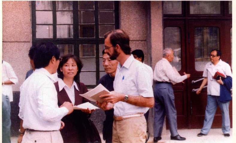
▶ 外国专家在山东农村调研