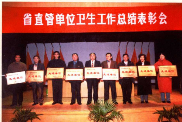
▲ 山东省卫生防疫站荣获省直管单位卫生工作先进单位