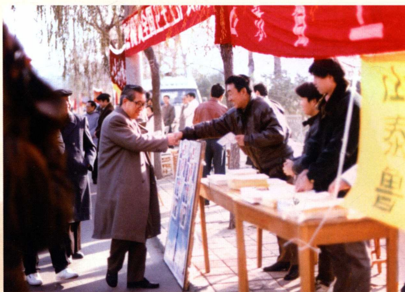
▶ 1995年，山东省卫生厅厅长张青林亲临卫生宣传现场