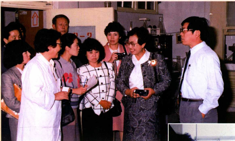
◀ 世界卫生组织专家来山东省卫生防疫站考察指导