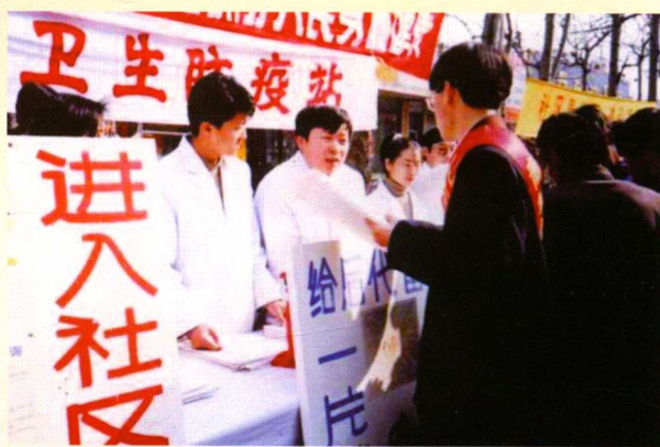
▲ 深入社区开展健康咨询宣传