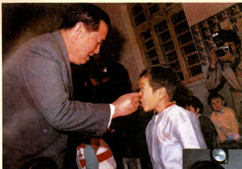
▶ 山东省原省委书记姜春云为儿童喂服糖丸