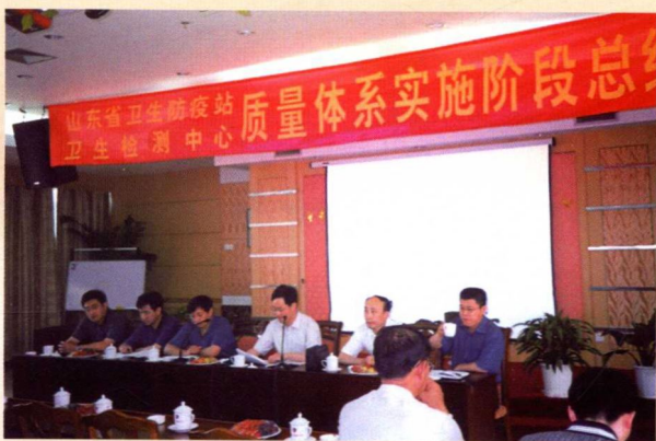
▲ 质量体系实施阶段总结大会