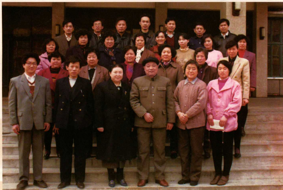
◀ 1993年山东省大肠菌群纸片法检测培训班