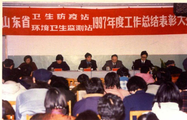
▲ 1997 年度工作总结表彰大会