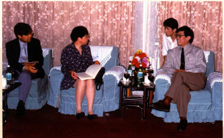
▶ 1995 年 JICA 项目日方专家来山东省开展项目评估工作