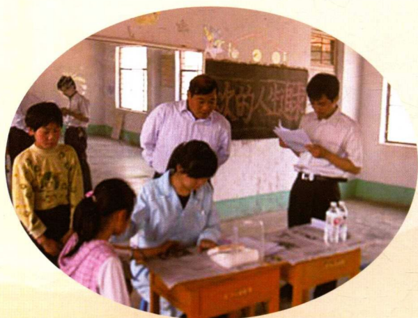
▲ 开展中小学生慢病干预