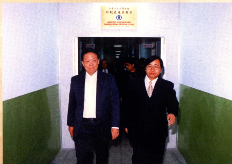
▶ 卫生部原副部长殷大奎来山东省卫生防疫站考察指导工作