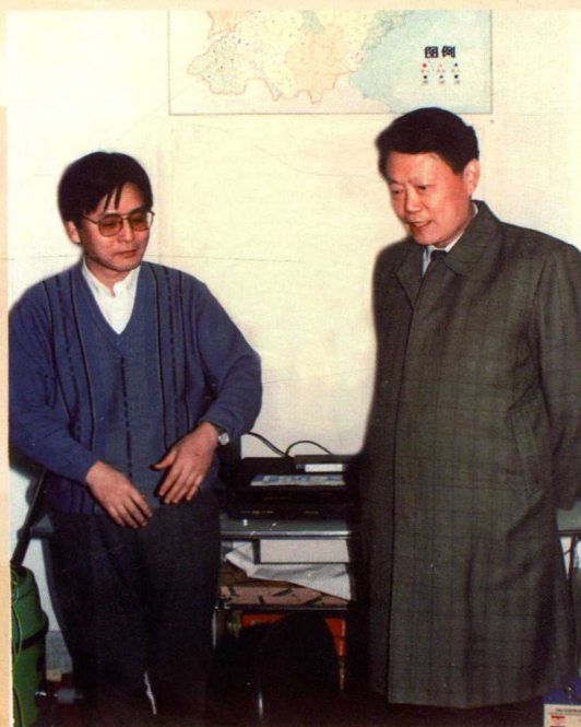
◀ 卫生部原副部长殷大奎来山东省卫生防疫站对 JICA 项目进行检查指导