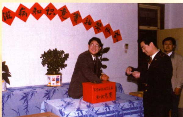
▲ 希望杯防治艾滋病知识竞赛