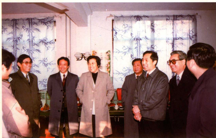
◀ 山东省人大常委会原副主任苗枫林、山东省原副省长吴爱英在山东省卫生厅原厅长张青林的陪同下来山东省卫生防疫站视察