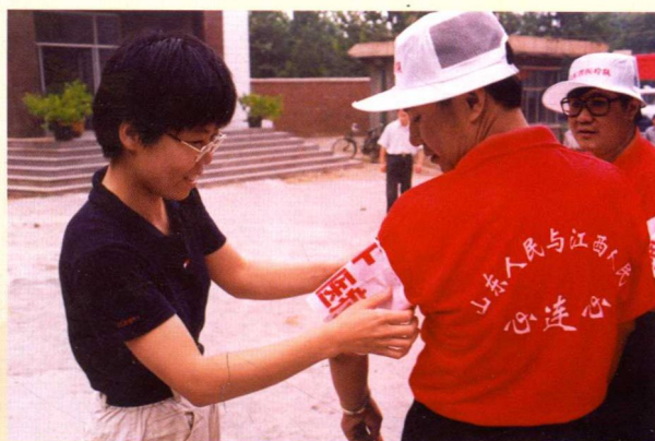
▲ 1998年赴江西九江救灾防疫队员出发时，家属殷殷送行