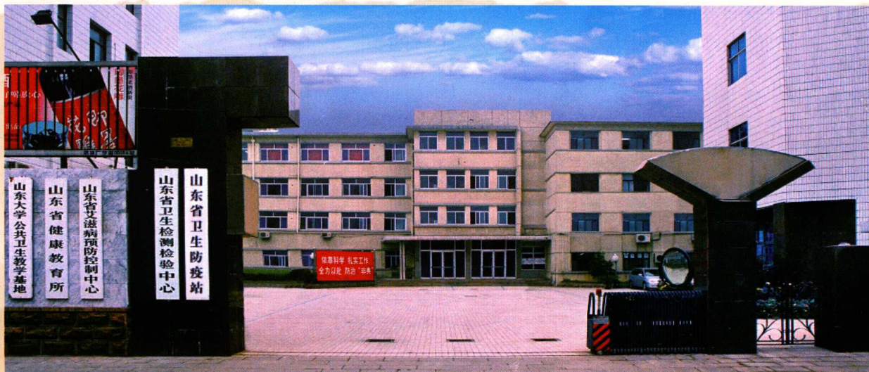
▲ 山东省卫生防疫站原貌