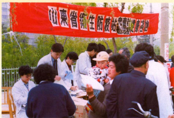
▲ 深入农村开展儿童计划免疫健康咨询