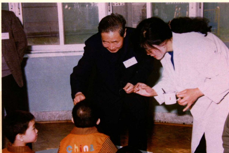
▶ 山东省人大常委会原副主任林萍为儿童喂服糖丸