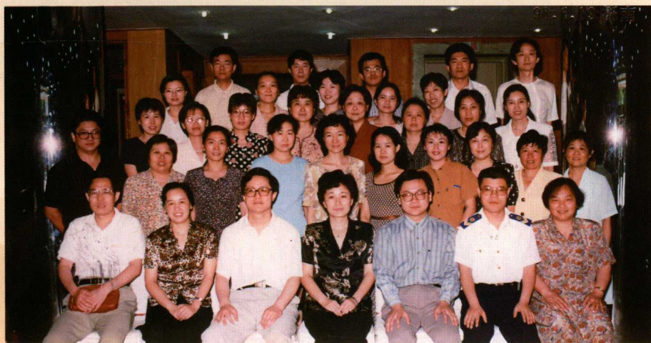
◀ 1998年6月全国食品中致泻性大肠杆菌污染状况调查课题协作组会议在山东召开