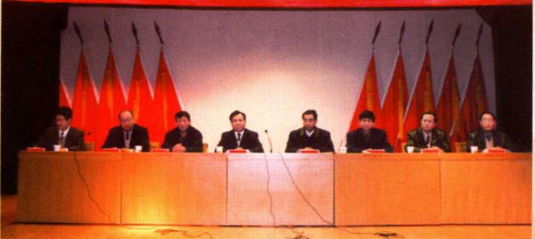
▲ 综合目标管理责任书签订仪式