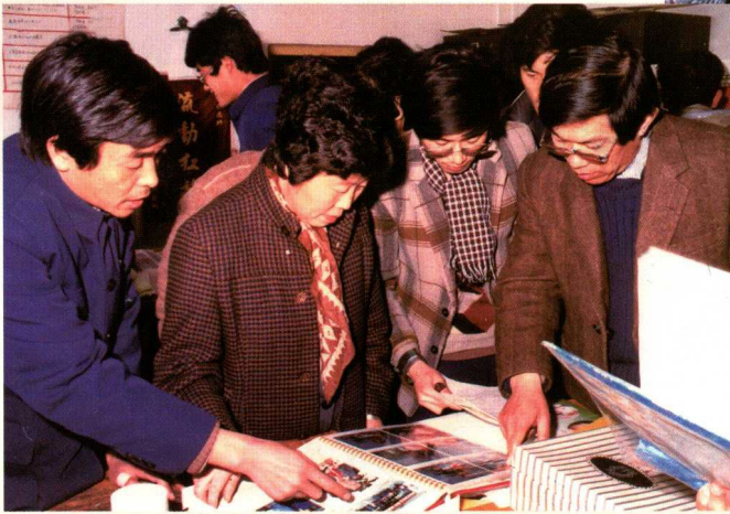
◀ 卫生部专家组来山东省检查计划免疫工作