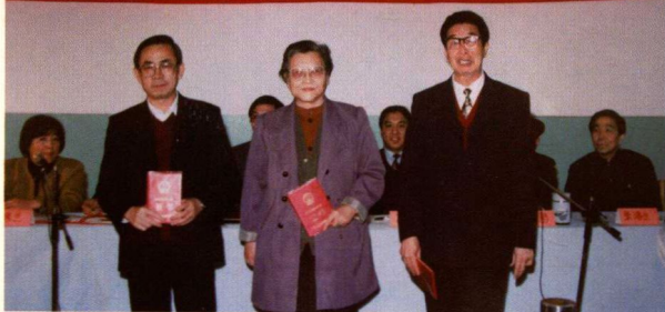
▲ 科室主任聘任大会