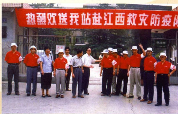
▲ 山东省卫生防疫站领导班子为赴江西九江救灾防疫队队员送行