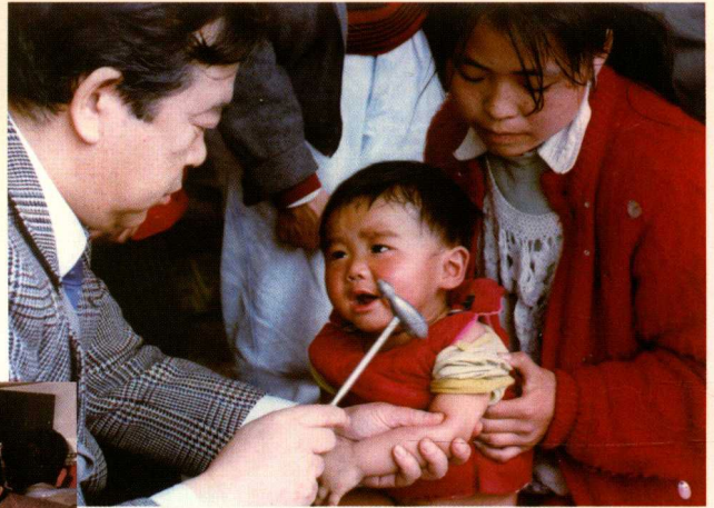
▶ JICA 消灭脊灰项目日方专家在为疑似病例做诊断