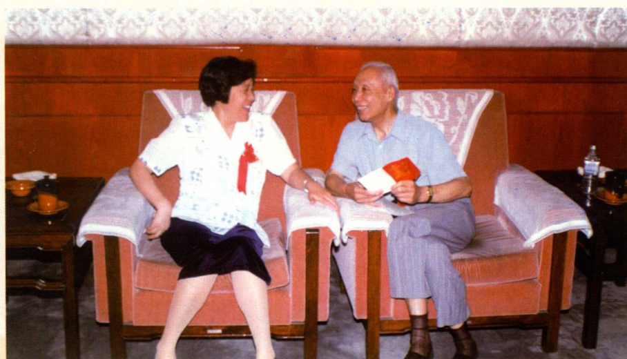
▶ 山东省原副省长吴爱英、山东省政协原副主席苏应衡来山东省卫生防疫站视察