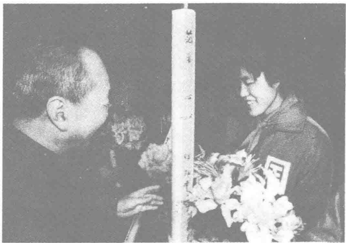
邢方群同志向十佳运动员郎平同志授奖 (1981年1月)