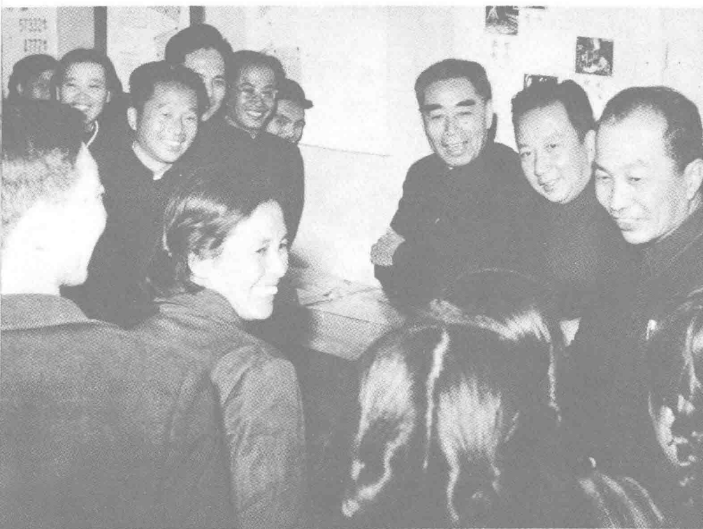
1963年10月18日 周恩来总理参加《中国青年》杂志创刊40周年纪念会。（右三为周总理，右二为胡克实，右一为邢方群。）