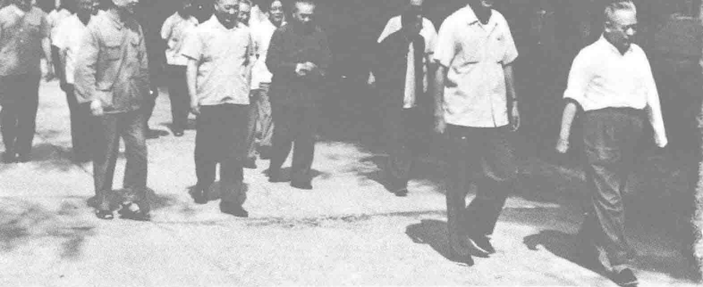
1979年7月15日，中央政治局委员余秋里（前排右一）、倪志福（前排右二）、中宣部常务副部长朱穆之（前排左二）参加《工人日报》创刊30周年纪念会。（前排左一为邢方群，《工人日报》社长兼总编辑）