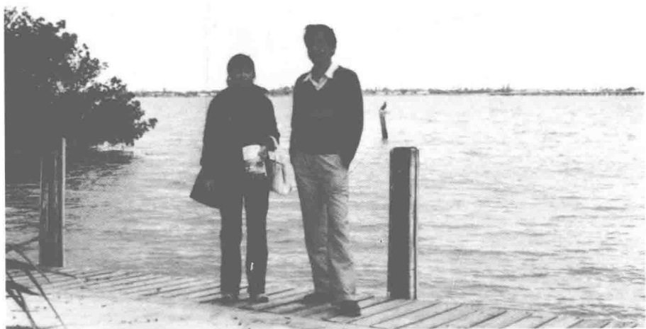
1985年赴美国南部旅游途中