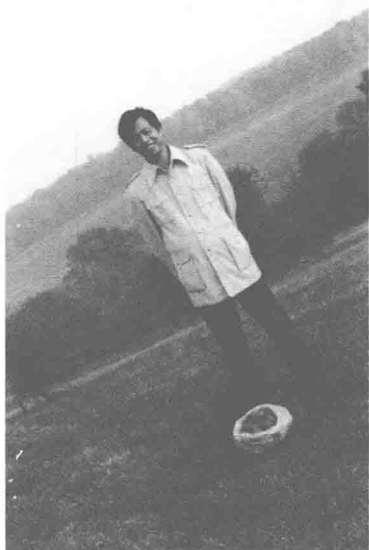
1980年代在匹兹堡农场