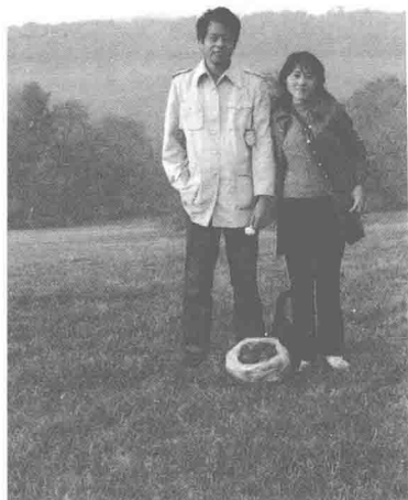
1980年代在匹兹堡农场