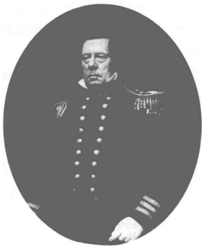
驾驶“黑船”敲开日本国门的男人 ——美国东印度舰队司令马休·佩里

广阔的太平洋呈现在眼前,美国人找到了一条便捷的新途径,那就是开辟太平洋航线。但是,蒸汽机轮船是要烧煤的,那时轮船吨位小,技术水平低,要一口气越过茫茫太平洋,载煤量根本不够,必须中途加煤,这样就需要一个燃煤供给点,美国人看来看去,发现把燃煤供给点设在日本最为合适。同时,日本还是一个很好的商品倾销市场。