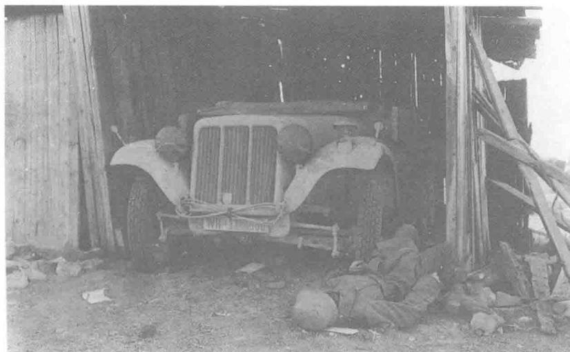
1943年2月初，突尼斯南部的舍涅德车站之战后留下的德军尸体。