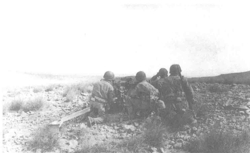
1943年2月14日，轴心国反攻凯塞林隘口最初几个小时内，美军反坦克炮手严阵以待西吉·布·吉特附近的德军坦克。