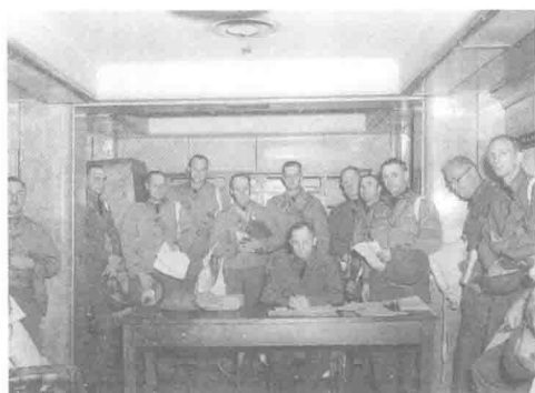
1943年5月，保罗·罗比内特上校（坐者）在前往北爱尔兰途中。身为第13装甲团团长，以及之后的第1装甲师第2团团长，罗比内特准将身高5英尺4英寸，有着令人印象深刻的战术技巧，但也因挑剔和骑兵般的自负而“人见人厌”。

第1装甲师师长奥兰多·沃德准将，赴非洲前在北爱尔兰短暂待过一段时间。他曾因一头红发，而被称为“平基”。沃德骁勇善战、志向远大、敏感，且从不信任英国人。