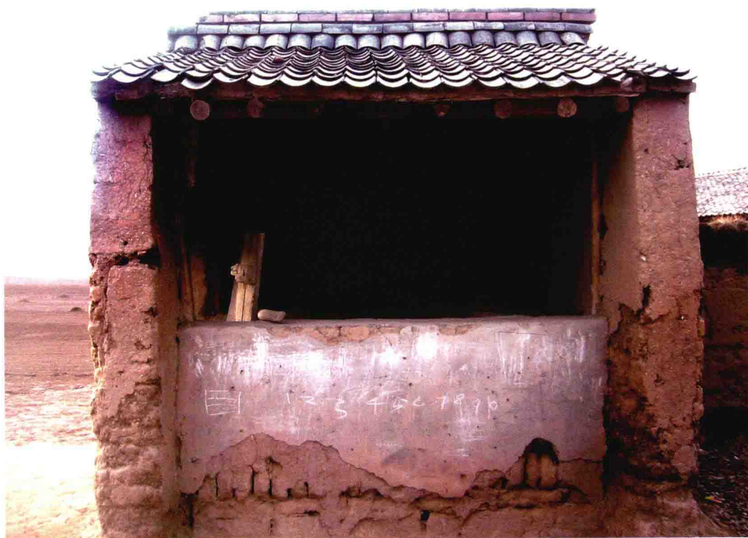
河北蔚县定安县村影戏、摆灯盏两用台