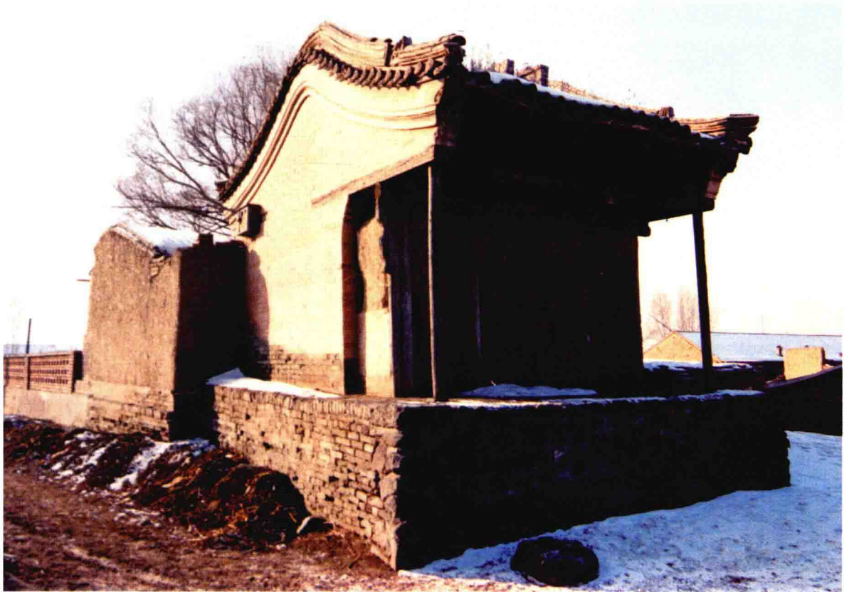
河北蔚县苑家庄古灯影戏台之一