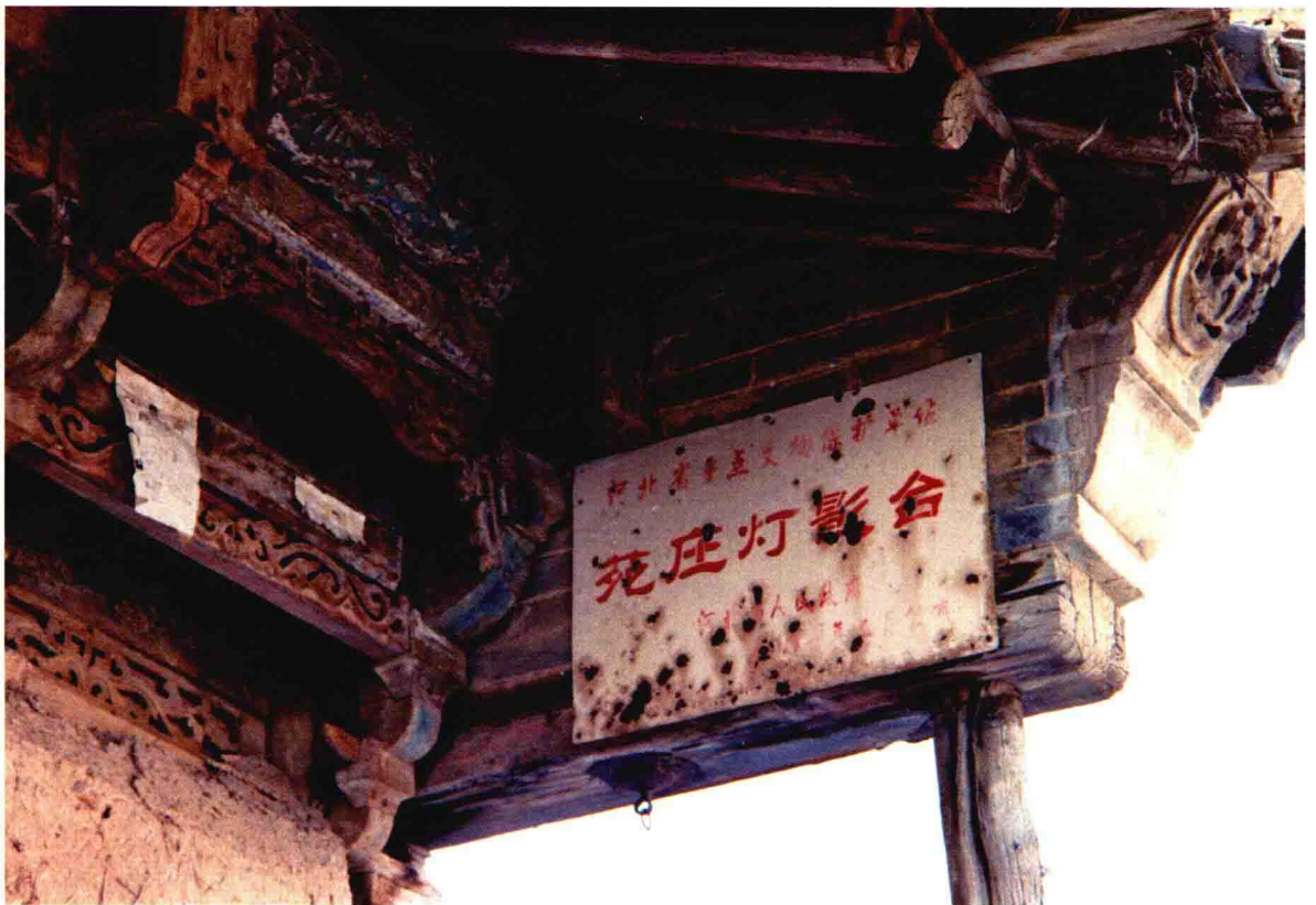
河北蔚县苑家庄古灯影戏台之二