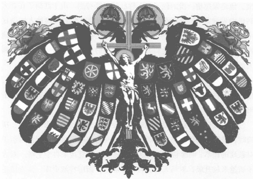
▲ 神圣罗马帝国 国徽

组成的伦巴德军在人数上是皇帝军队的一倍，他们取得了决定性的胜利。这个战役让巴巴罗萨名誉扫地，独立的市民军队首次战胜了皇帝的骑士军队。城市从此真正有了独立权，为以后发展商品经济、最早出现资本主义萌芽甚至文艺复兴都扫除了障碍。更为重要的是，皇帝在与教皇的争斗中败下阵来，巴巴罗萨最后竟然屈辱地吻了教皇的脚。