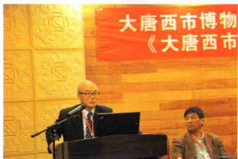
韩国首尔大学名誉教授朴汉济发言