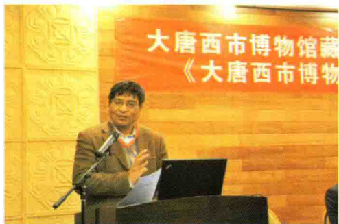
中国唐代文学学会会长陈尚君致贺辞