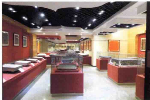
大唐西市博物馆墓志展厅