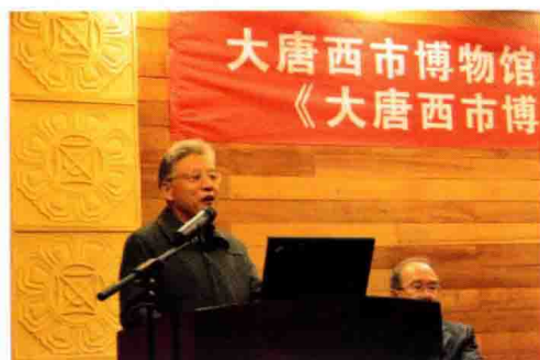
陕西省社联主席赵世超讲话