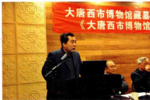
陕西省文物局副局长刘云辉讲话