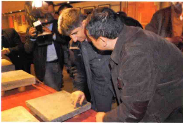
与会学者察看回鹘王子墓志