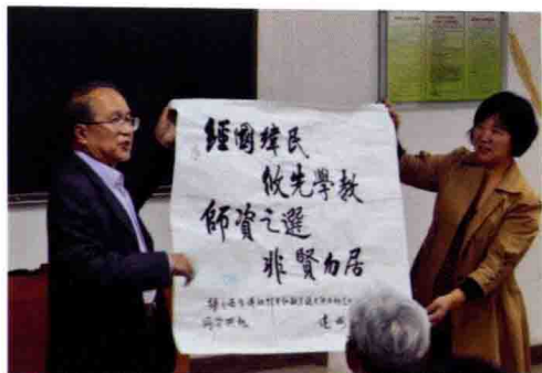
连树声老师书西市墓志警句赠陕师大学生