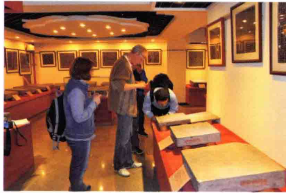
与会学者察看回鹘王子墓志