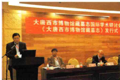
刘屹宣读中国敦煌吐鲁番学会会长郝春文贺信