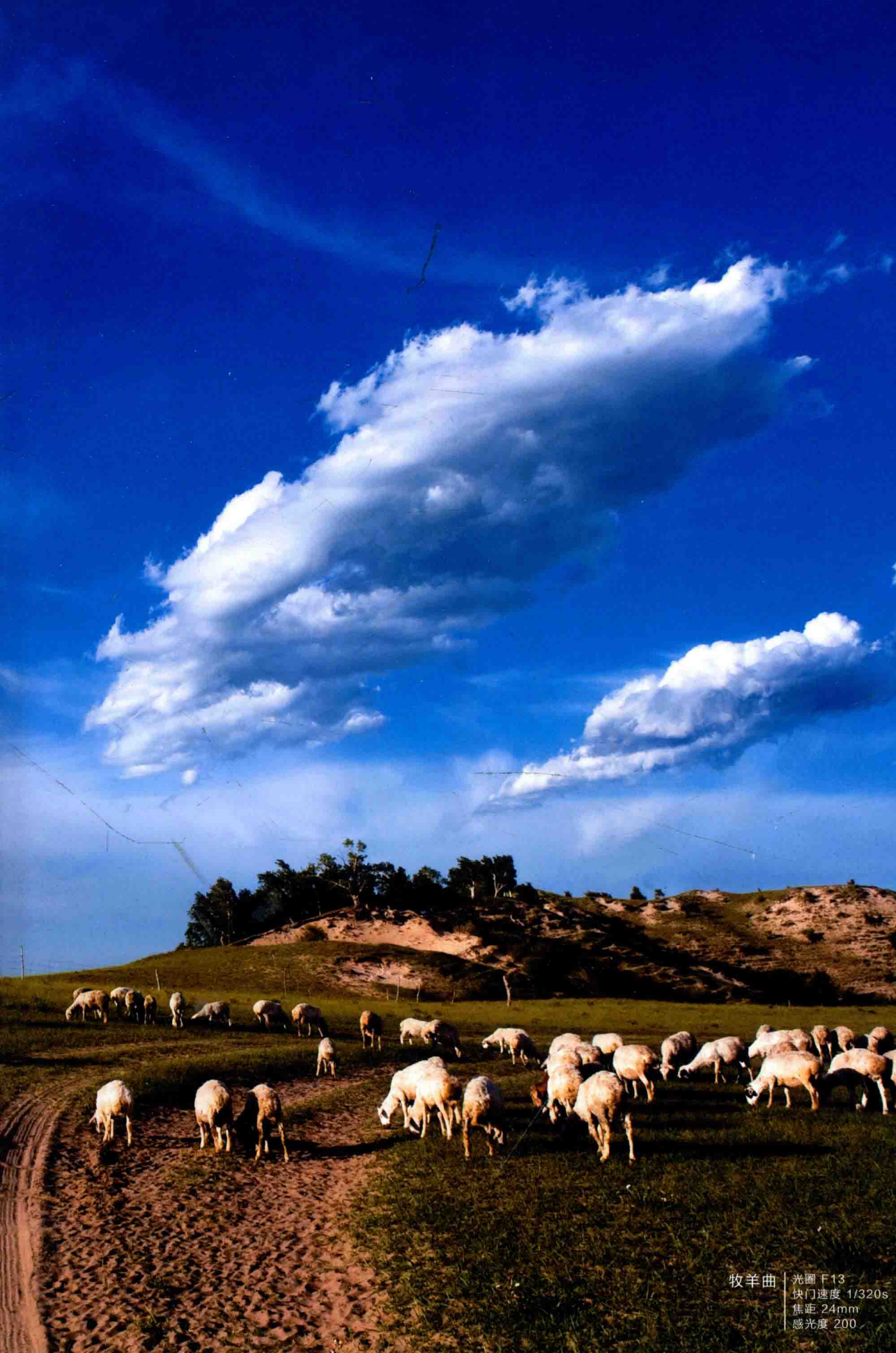
牧羊曲 | 光圈 F13 快门速度 1/320s 焦距 24mm 感光度 200