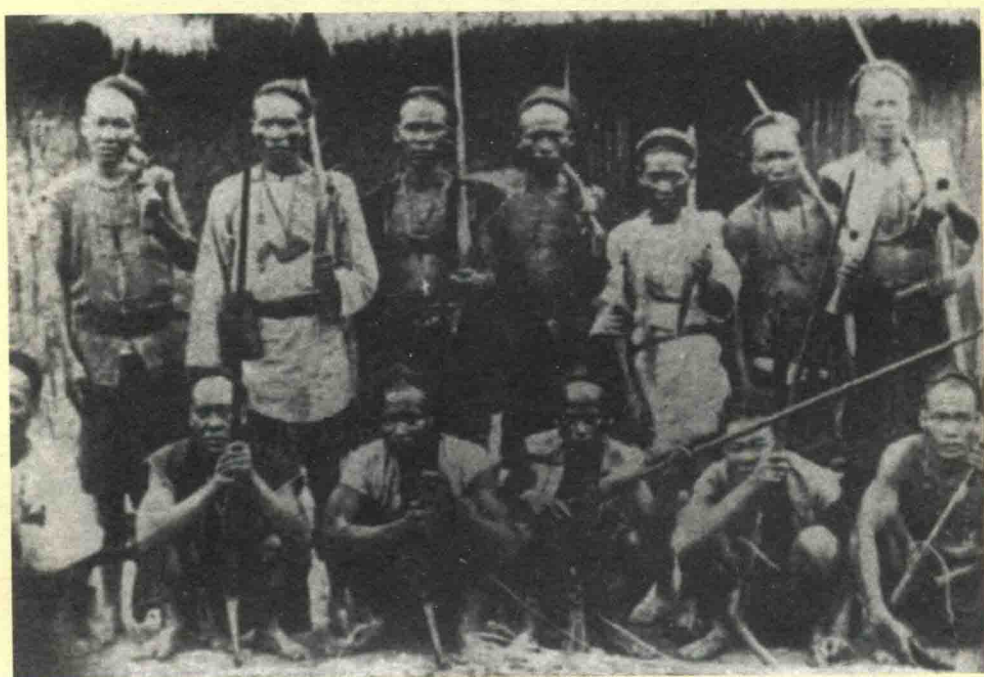
『台灣民主國』失敗後，台灣人民的抗日活動仍此起彼伏，風起雲湧。 圖為平埔族抗日戰士。