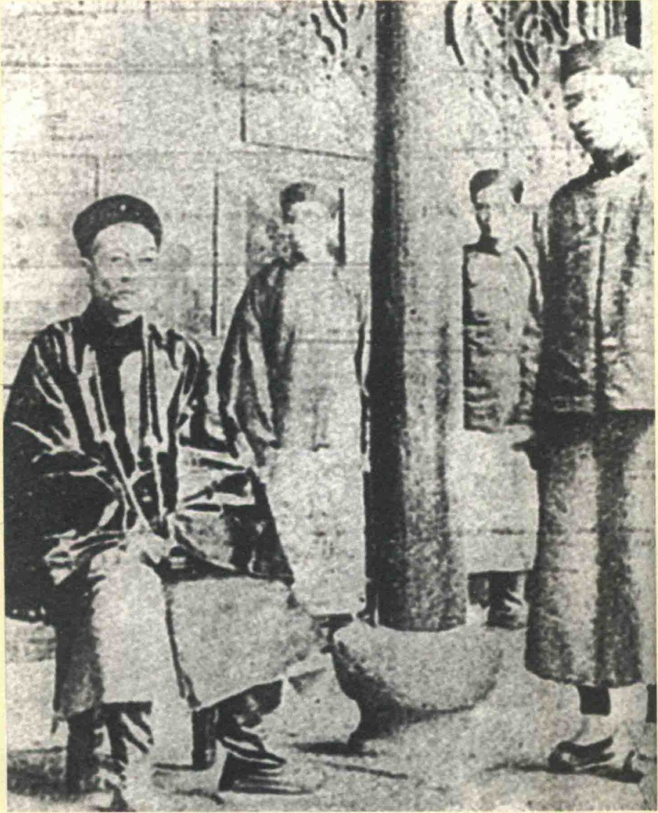
1895年5月，『台灣民主國』宣布成立，推舉唐景崧為大總統、丘逢甲為副總統兼團練使。圖中坐者為唐景崧。