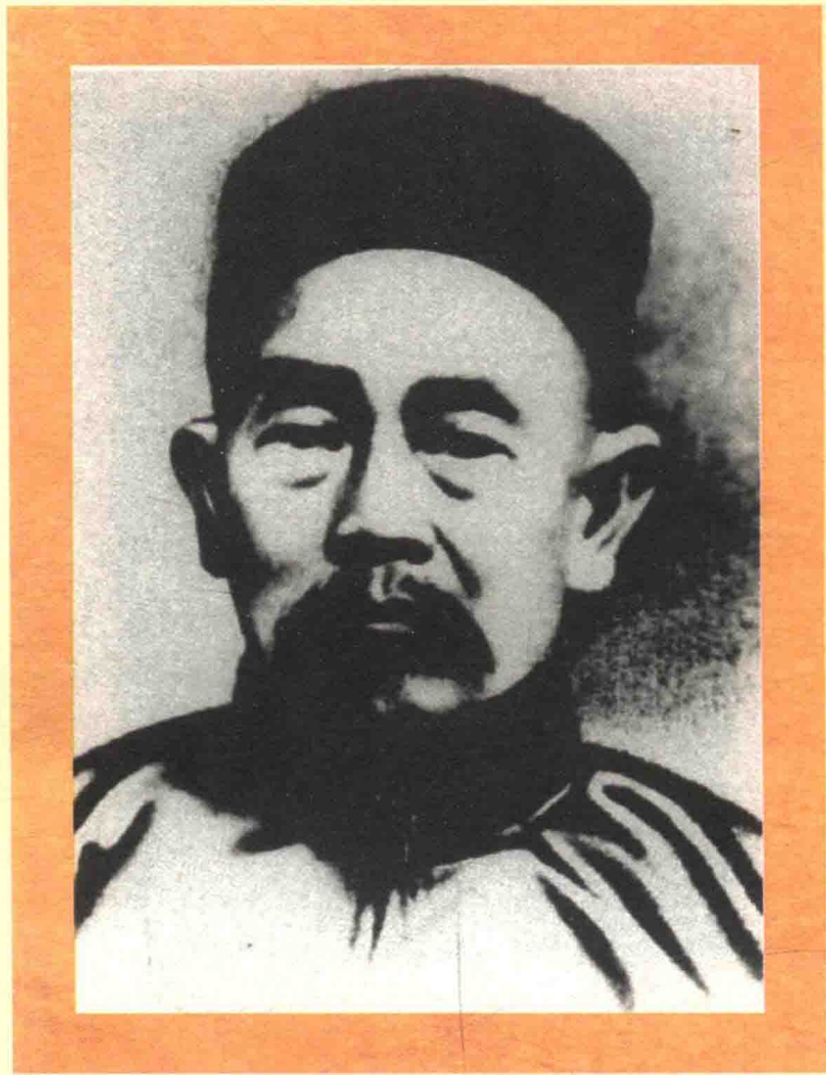
台灣抗日志士陳秋菊，曾於 1913 年晉見孫中山，商討國事。