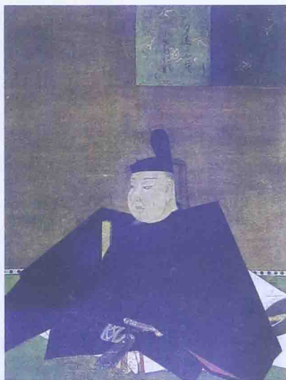
源赖政画像，现存静冈热海美术馆。摄津源氏，是平氏专权时期位阶最高的源氏朝臣。他劝说后白河法皇第三子以仁王兴兵反抗平氏，并由发出号召诸源的法皇纶旨，是源氏平合战的首义。

夫自以为得到了赖朝的格外青眼，皆是欢欣鼓舞，意图报效。源赖朝这个女婿啊，军政武勇都稍差人意，唯有这人心笼络的手段是娴熟无比。