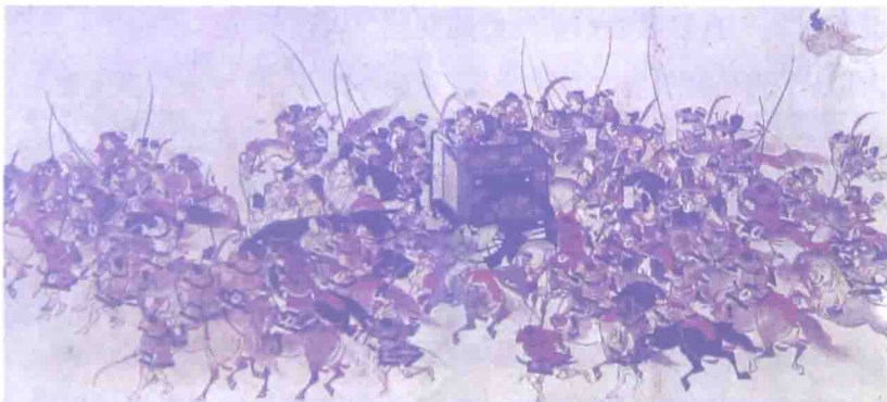
《平治物语绘卷》之“上皇出巡”

何况，京都来的消息，入道相国的昏聩跋扈已经叫法皇殊为气愤，这天下气运的变化，还真是神鬼莫测啊。