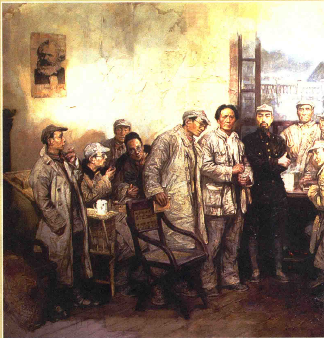
遵义会议 油画作者：沈尧伊